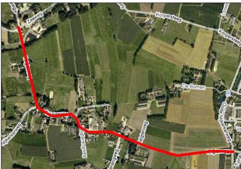
Figuur 2. Tracé fietspad Telgterweg