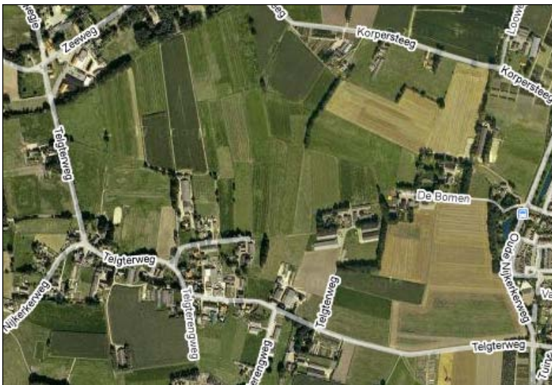
Figuur 1. Ligging Telgterweg

Voor de aanleg van het fietspad langs de Telgterweg is herziening noodzakelijk van een deel van het vigerende bestemmingsplan "Buitengebied Midden-West", vastgesteld 9 juli 2009 en in werking getreden met ingang van 17 juni 2010". Het voorliggende bestemmingsplan Ermelo - Fietspad Telgterweg betreft het planologisch mogelijk maken van de aanleg van vrijliggende fietspaden en fietsstroken langs de Telgterweg. In het nieuwe bestemmingsplan wordt inhoudelijk aangesloten op het huidige bestemmingsplan Buitengebied Midden-West. De ligging is op bijgaande figuur 1 aangegeven.