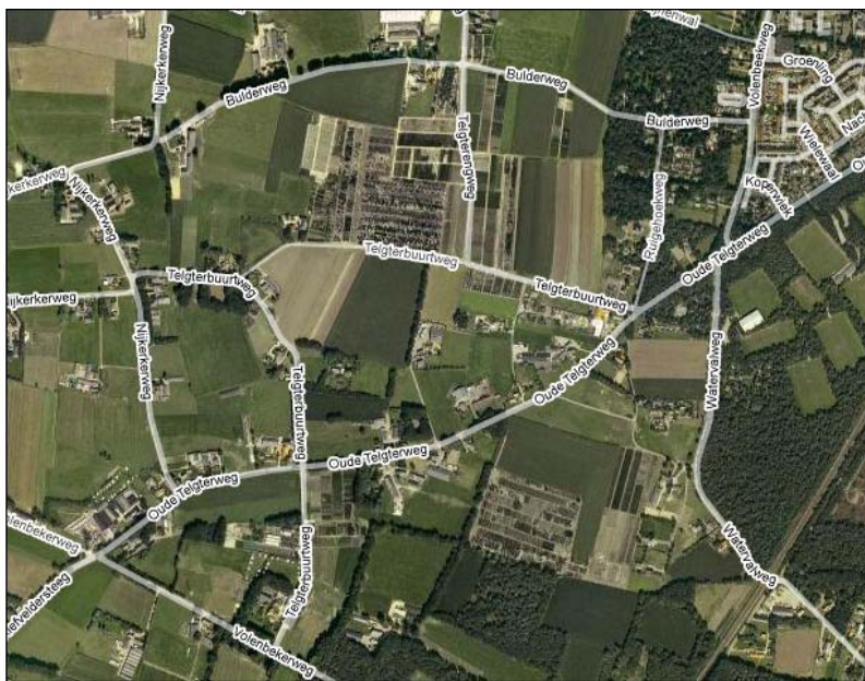
Figuur 1. Ligging Oude Telgterweg

Voor de aanleg van het fietspad langs de Oude Telgterweg is herziening noodzakelijk van een deel van de vigerende bestemmingsplannen “Buitengebied Midden-West”, vastgesteld 9 juli 2009 en in werking getreden met ingang van 17 juni 2010 een deel van het bestemmingsplan “West 1978”, vastgesteld 28 november 1978, goedgekeurd 11 januari 1980. Het voorliggende bestemmingsplan Ermelo - Fietspad Oude Telgterweg betreft het planologisch mogelijk maken van de aanleg van een vrijliggend fietspad langs de Oude Telgterweg. In dit nieuwe bestemmingsplan wordt inhoudelijk aangesloten op het huidige bestemmingsplan Buitengebied Midden-West. De ligging is op bijgaande figuur 1 aangegeven.