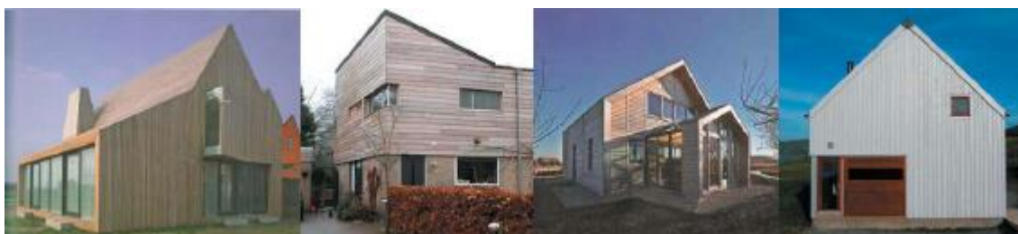
Vier woningen, die door hun samenhang in vormgeving een harmonieus ensemble kunnen vormen.