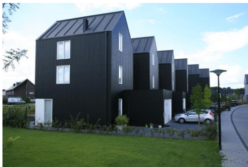
Gevels voornamelijk van hout en glas;