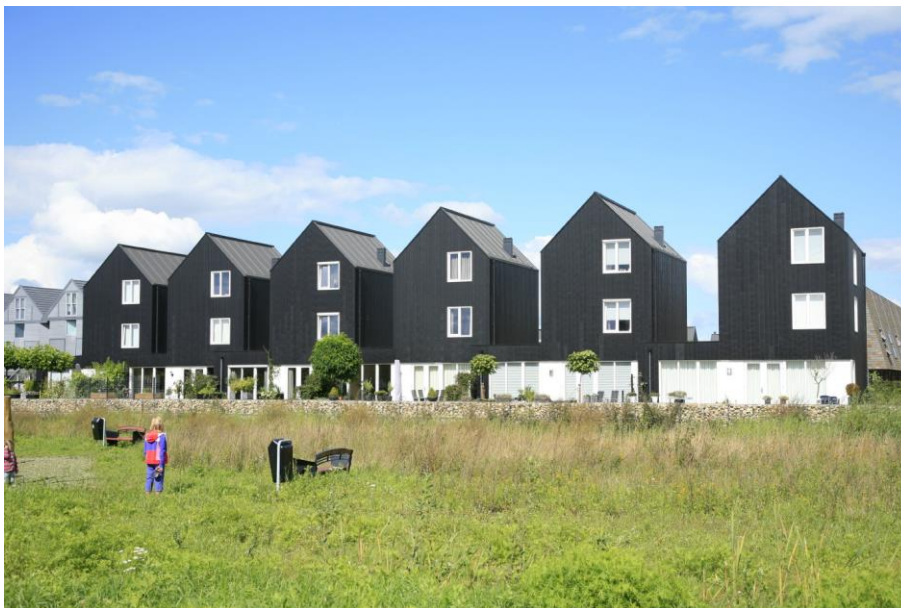
Voorbeeld van tuinen met lage tuinmuur, grenzend aan groenstrook.

De voortuinen liggen in de buitenste schil van het plangebied. Dit gebied heeft de bestemming 'Groen'. Dit wil zeggen dat er in dit deel van de kavels geen bebouwing mogelijk is. De voortuinen vormen de overgang naar het open landschap en/of de Wildemaetstraat en moeten daarom bestaan uit gras, een wadi met een rietkraag langs het weiland, of een haag langs de Wildemaetstraat.