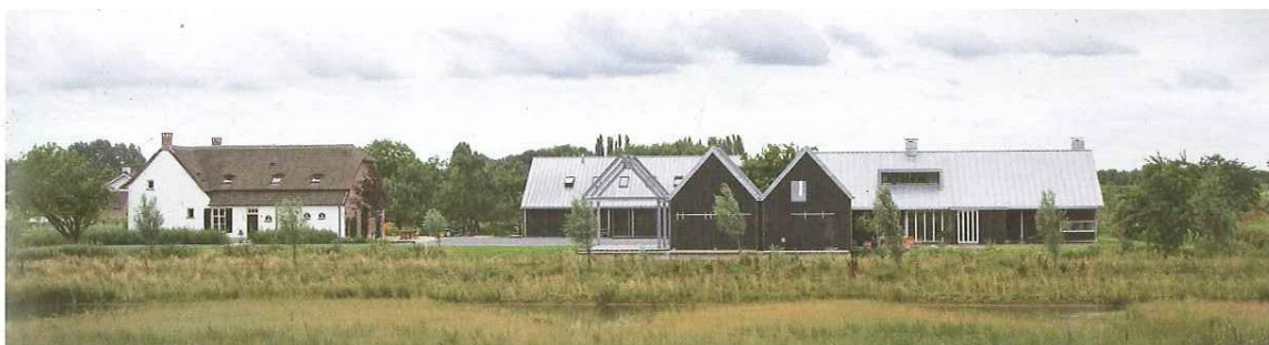
Ensemble van nieuwbouw naast een bestaande boerderij.

Voor de 5 kavels kunnen de kopers een keuze uit de voorgeselecteerde architecten of concept-bouwer maken, zodat iedere koper een eigen en maatwerk-huis kan laten ontwerpen. Door de variatie in wensen en smaak zullen de woningen heel verschillend zijn. De verschillende architecten zullen op zoek moeten naar harmonie en samenhang. De vijf kavels moeten een nieuw ensemble worden met een passend silhouet in het landschap.