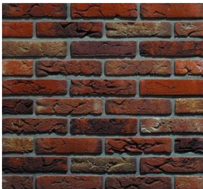
Niet meer dan 25% metselwerk

Aan de buitenzijde zijn de gevels voornamelijk van hout en glas en aan de achtertuinzijde overheerst het steen als gevelmateriaal.