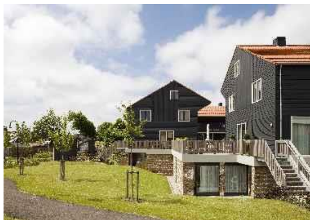
Ensemble in parkachtige omgeving.