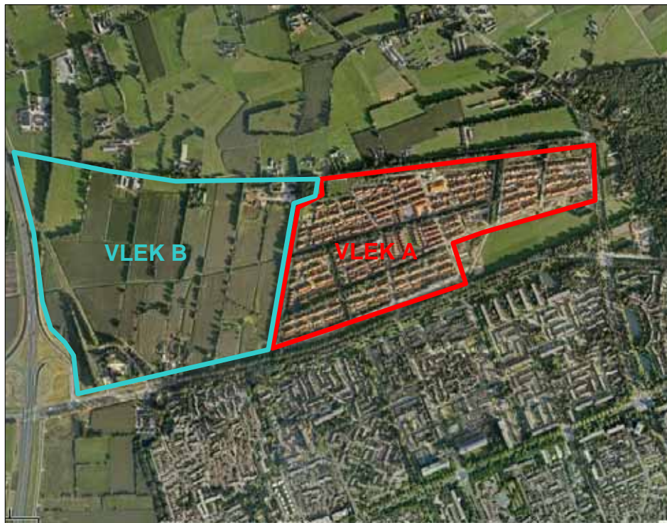
Situering Vlek A en Vlek B