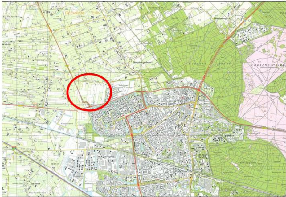
Globale ligging plangebied