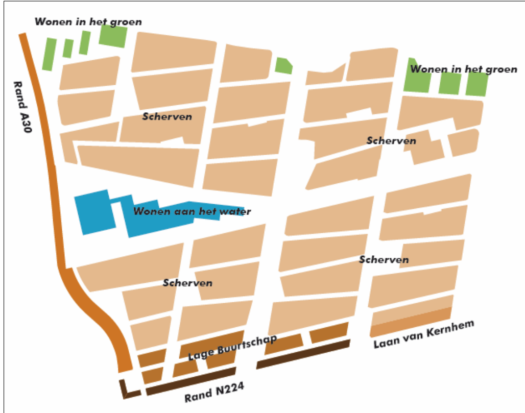
De verdeling in scherven en buurtschappen binnen de wijk