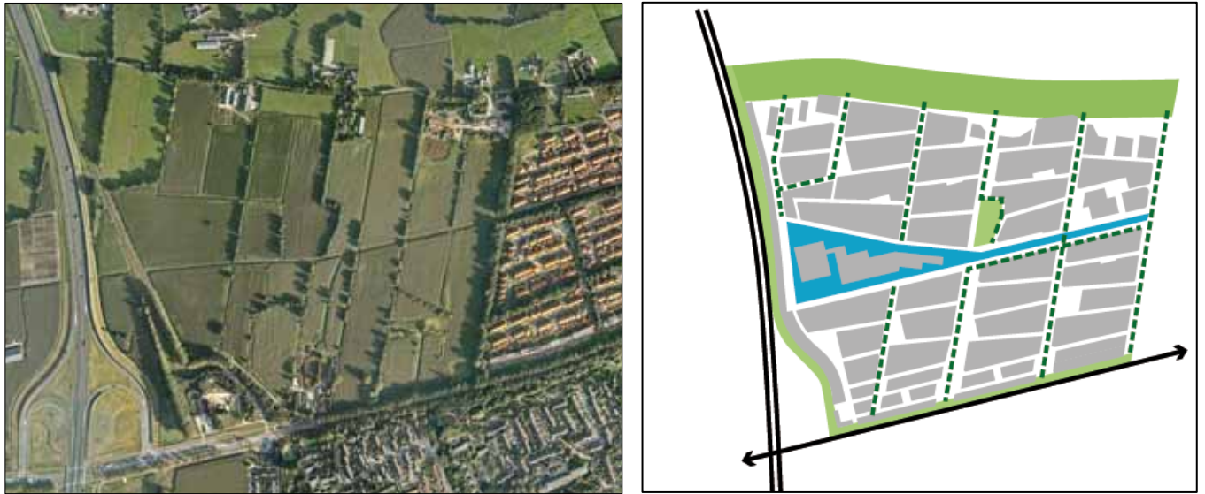
het landschap als onderlegger voor de stedenbouwkundige structuur voor Vlek B

Ten slotte sluit de busroute door dit wijkdeel aan op de reeds bestaande busroute in Vlek A, zodat ook in dit deel sprake is van een optimale ontsluiting per openbaar vervoer.