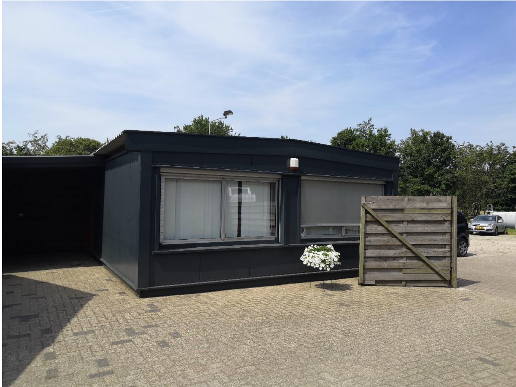
Figuur 3 Keet (B).