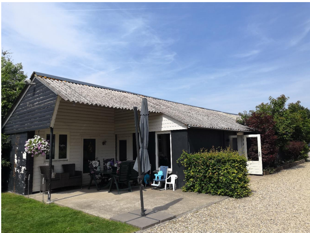
Figuur 2 Schuur (A).