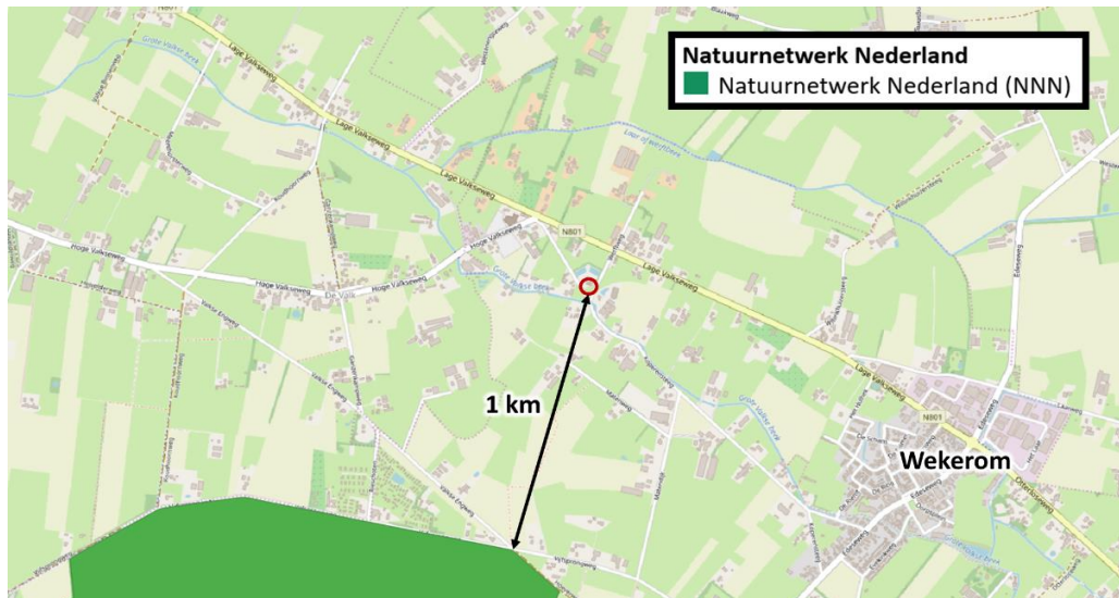
Figuur 3 De planlocatie ligt op een afstand van circa 1 km tot het Natuurnetwerk Nederland.

De beoogde ontwikkeling betreft het saneren van vier schuren ten behoeve van de realisatie van een bijgebouw en bedrijfsloods. De werkzaamheden zullen waarschijnlijk leiden tot een tijdelijke en zeer beperkte toename in stikstofuitstoot (projecteffect). Over de langere termijn zal er geen sprake zijn van toename van een stikstofuitstoot.