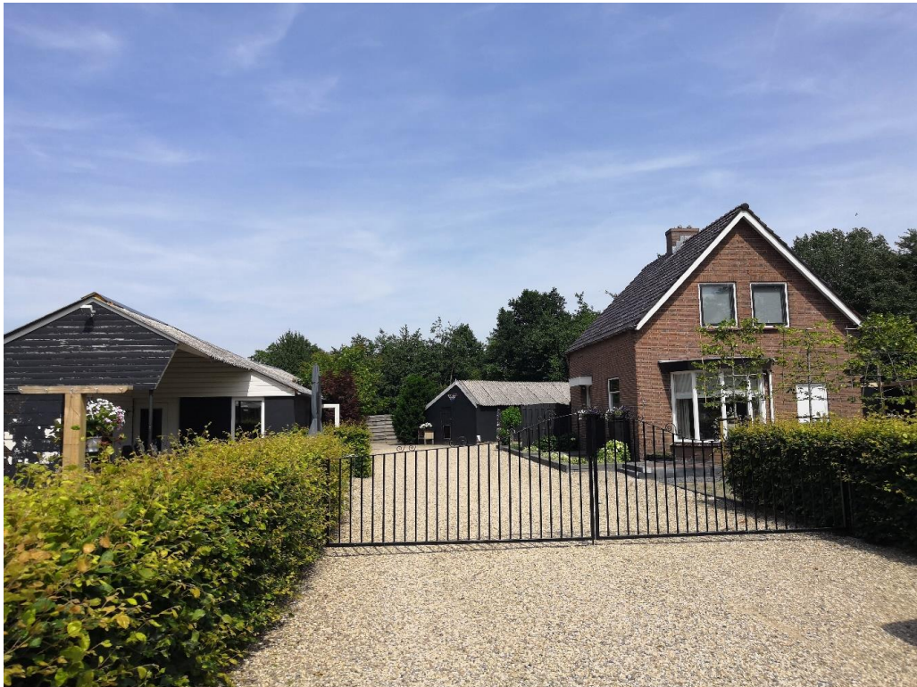
Figuur 1 De planlocatie is gelegen aan de Koperensteeg 40 te Wekerom en bestaat uit een woning en vier bijgebouwen.