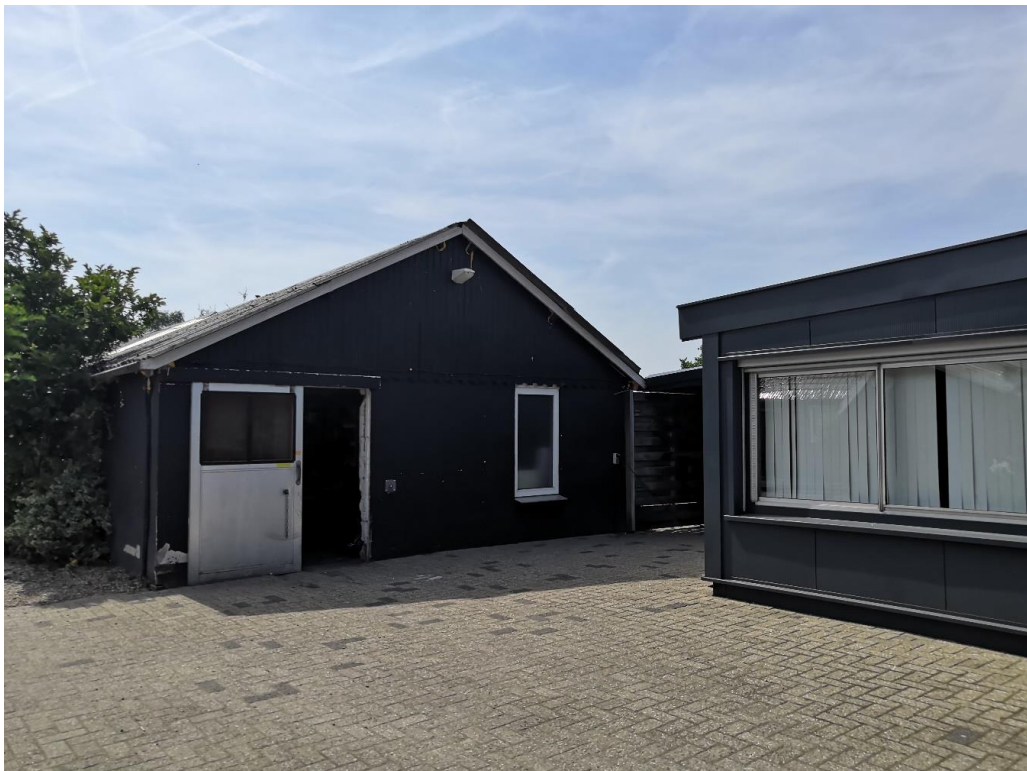
Figuur 4 Schuur (C).