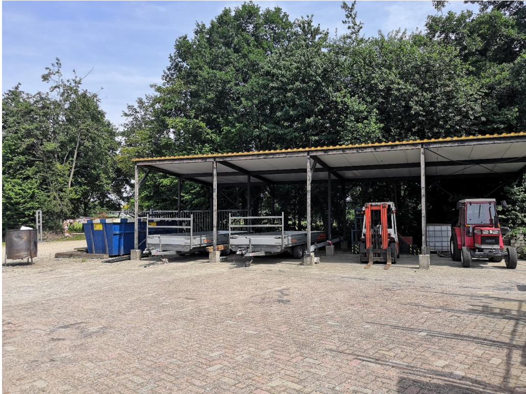
Figuur 5 Overkapping (D).