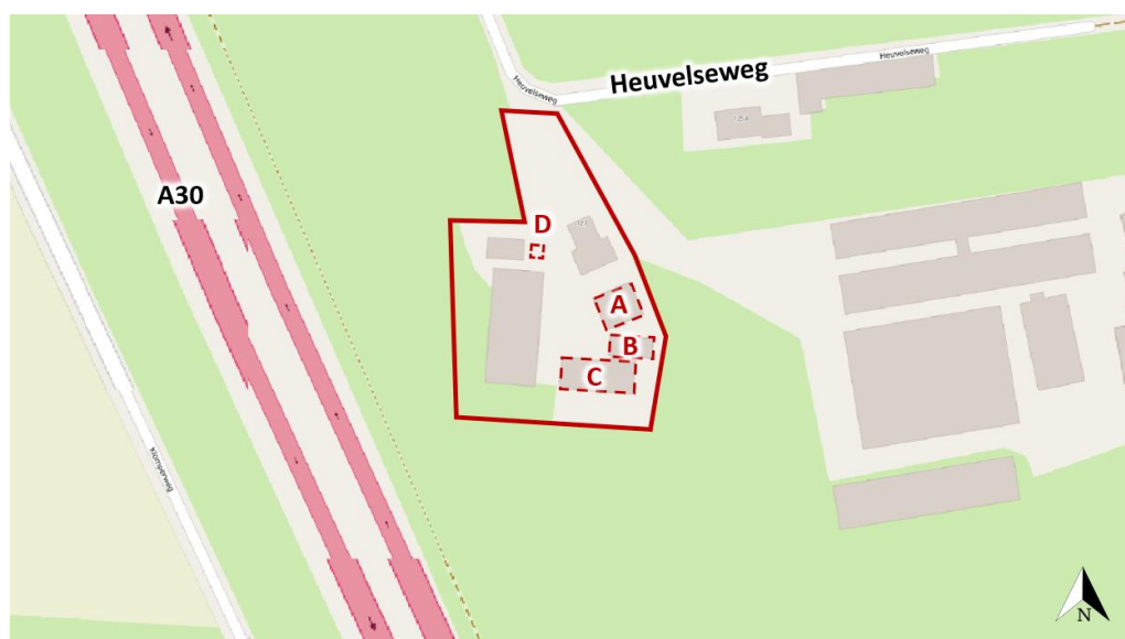
Figuur 1 De planlocatie (rood omkaderd) is gelegen aan de Klomperweg 127 te Lunteren. De rode stippellijnen weergeven de te saneren gebouwen.

De directe omgeving van de planlocatie wordt gekenmerkt door agrarisch gebruik. De bebouwde kom van Lunteren is circa 1,2 km ten noordoosten gelegen. Vrijwel direct ten westen ligt op circa 50 m afstand de A30.