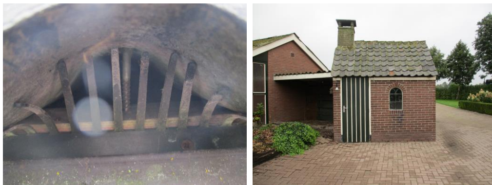
Figuur 4 Links: vogelschroot onder de golfplaten van de te saneren schuur. Rechts: het kleine te saneren bijgebouw.

De huismus maakt nesten in hoofdzakelijk bebouwing, vrijwel uitsluitend onder pannendaken, maar sporadisch ook in golfplaten daken. Het voorkomen van nestlocaties van huismussen in de te saneren opstallen kan echter uitgesloten worden door de afwezigheid van dakbeschot onder de golfplaten daken van de hooischoor en de stal. Daarnaast is in schuur B vogelschroot aanwezig. Het kleine bijgebouw (figuur 4) heeft wel dakpannen en een dakbeschot, maar is de goothoogte circa anderhalve meter. Wegens de aanwezigheid van katten, die zeer eenvoudig toegang kunnen krijgen tot mogelijke nestlocaties, is het uitgesloten dat er in dit bijgebouw nestlocaties van huismussen aanwezig zijn. De waargenomen huismussen zijn gezien en gehoord op het naburige perceel Klomperweg 125. Hier zijn woningen met een zadeldak en wolfsdak van dakpannen aanwezig, aannemelijk veel geschiktere nestlocaties dan op de planlocatie. Het is dan ook zeer de verwachting dat de aanwezige huismussen nestelen bij de burens. Relevante groenstructuren zijn de coniferen die als afscheiding dienen. Deze blijven behouden in de beoogde ontwikkeling waardoor deze niet resulteert in afname van essentieel leefgebied. Van aantasting van functioneel leefgebied en nestlocaties van de huismus is derhalve geen sprake.