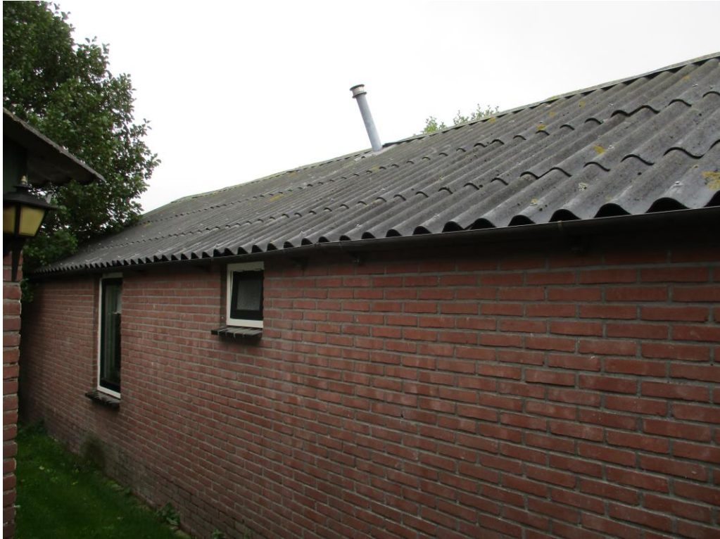
Figuur 3 De schuur is opgetrokken uit gemetselde muren zonder spouw en heeft een golfplaten dak zonder dakbeschoot. Hier is vogelschroot aangebracht.