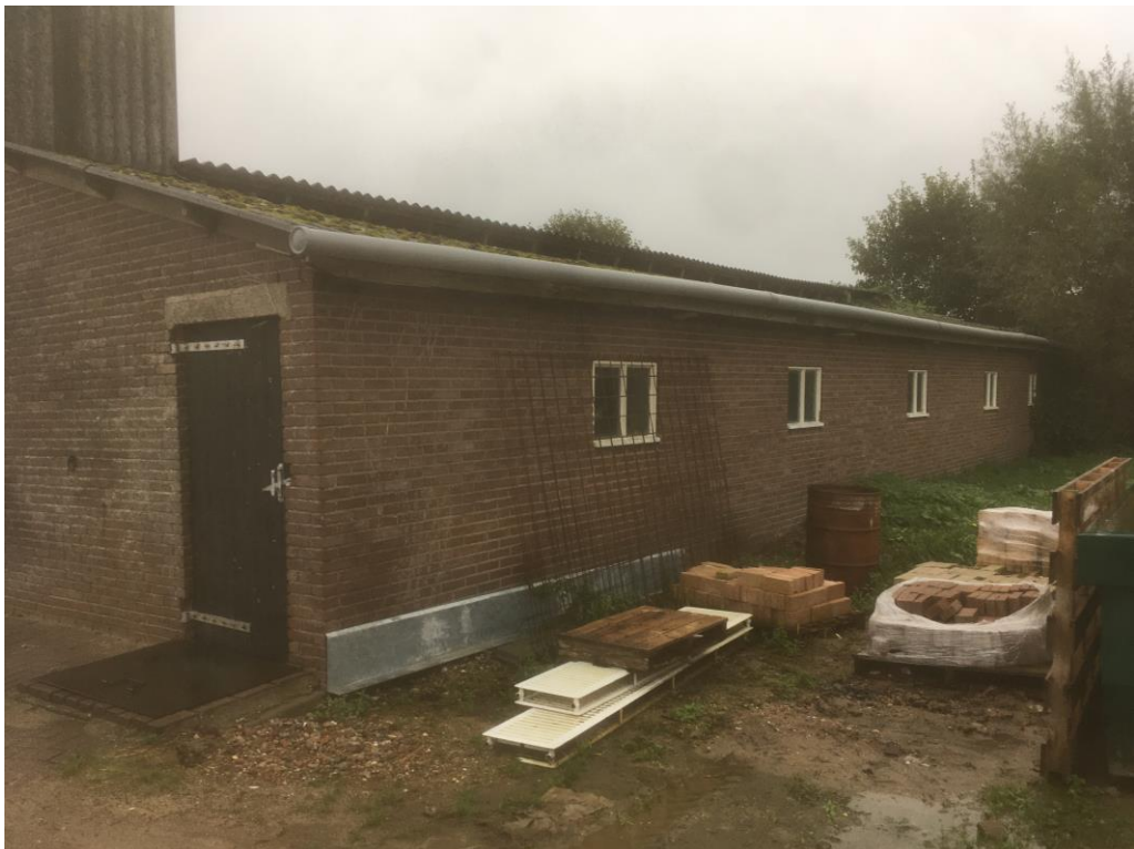
Figuur 4 De stal is opgetrokken uit gemetselde muren zonder spouw en heeft een golfplaten dak zonder dakbeschoot.