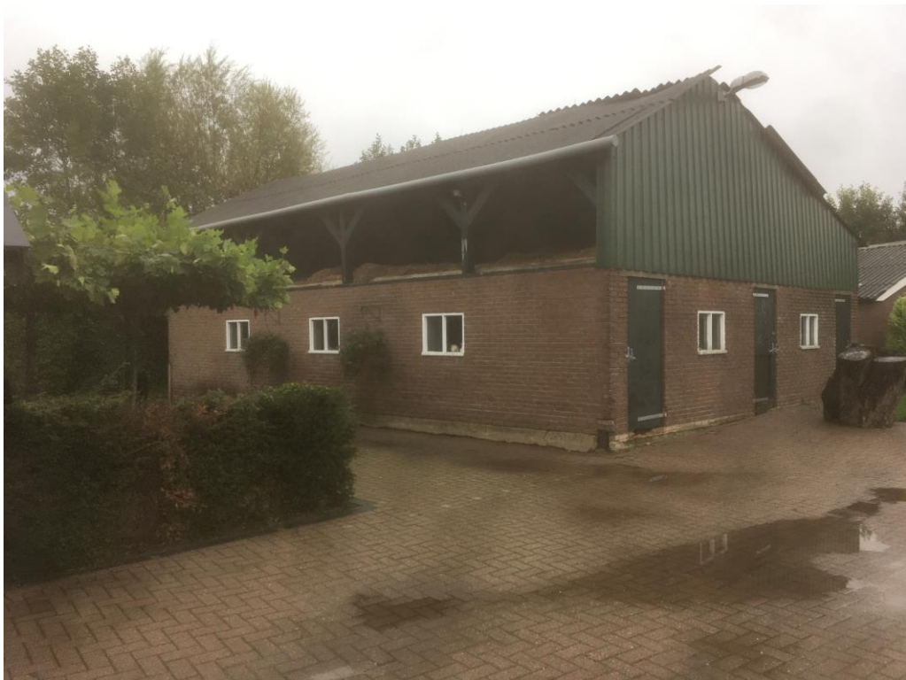
Figuur 2 De hooischuur is opgetrokken uit gemetselde muren met damwandplaten en heeft een golfplaten dak zonder dakbeschoot.