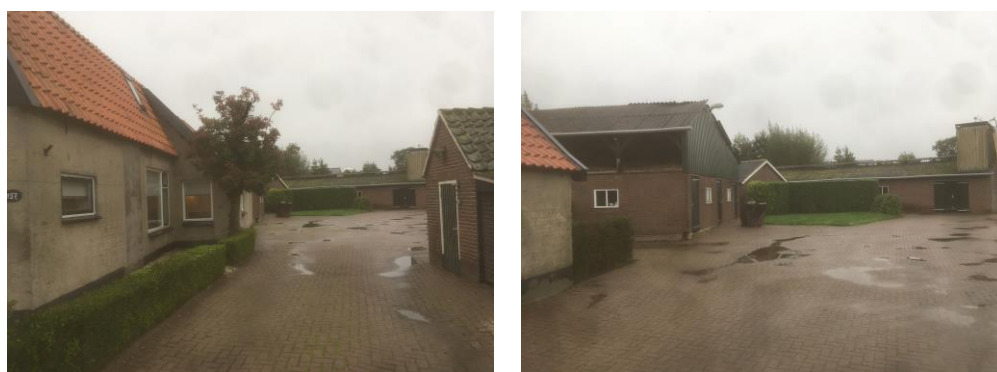
Figuur 2 Fotografische indruk van de planlocatie en de directe omgeving hiervan (foto's aangeleverd door de initiatiefnemer).