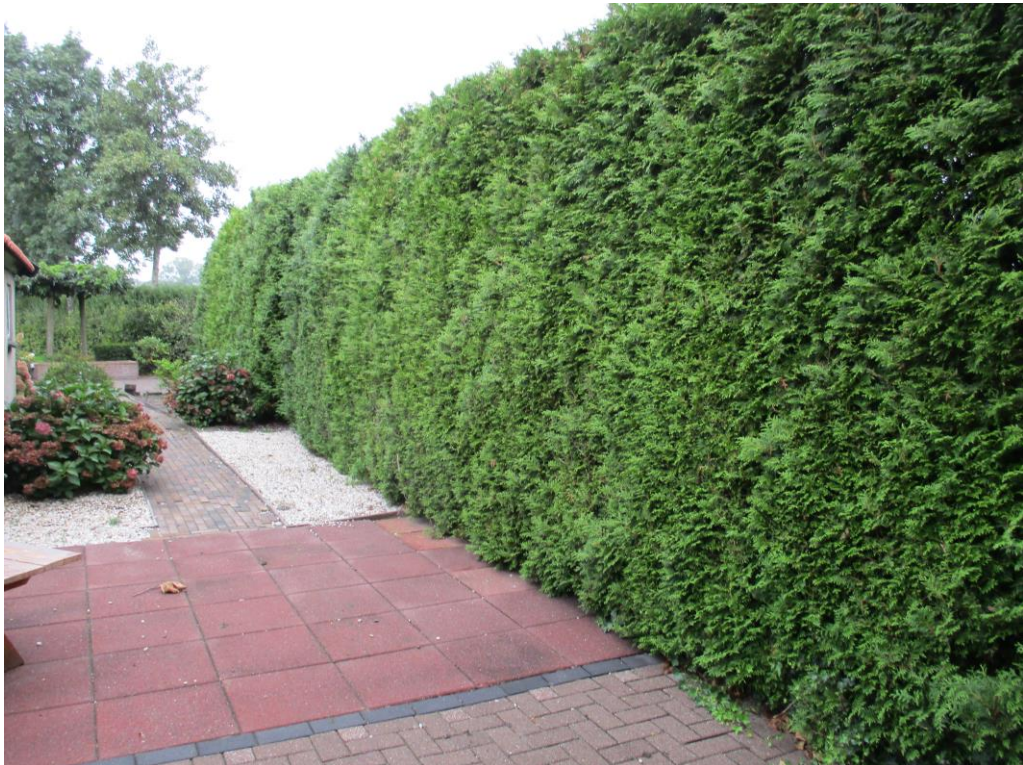
Figuur 6 Tussen de woning en het perceel Klomperweg 125 is een coniferenhaag als erfscheiding aanwezig. Deze biedt zeer waarschijnlijk beschutting voor huismussen en dient derhalve behouden te blijven.