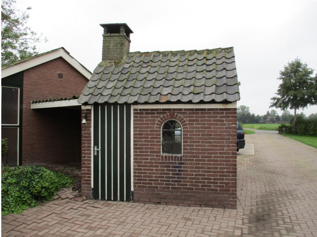
Figuur 5 Het kleine bijgebouw is opgetrokken uit gemetselde muren zonder spouw en heeft een pannendak met dakbeschot.