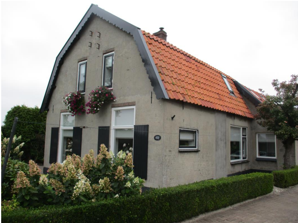
Figuur 1 De planlocatie is gelegen aan de Klomperweg 127 te Lunteren en bestaat uit een boerenwoning (welke blijft behouden) en enkele opstallen waar de initiatiefnemer voornemens is een viertal opstallen te saneren.