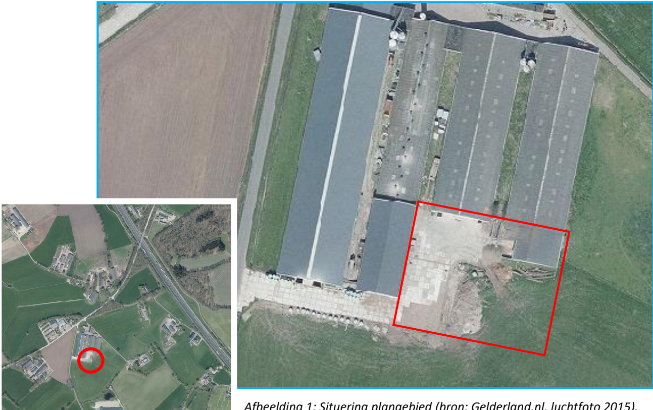
Afbeelding 1: Situering plangebied.

Het plangebied ligt in het buitengebied, ten noordwesten van de bebouwde kern van Lunteren en betreft verharding, grasland en een uitbouw. De directe omgeving bestaat uit agrarische percelen.