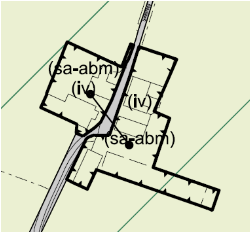
fragment van de verbeelding bij het huidige bestemmingsplan