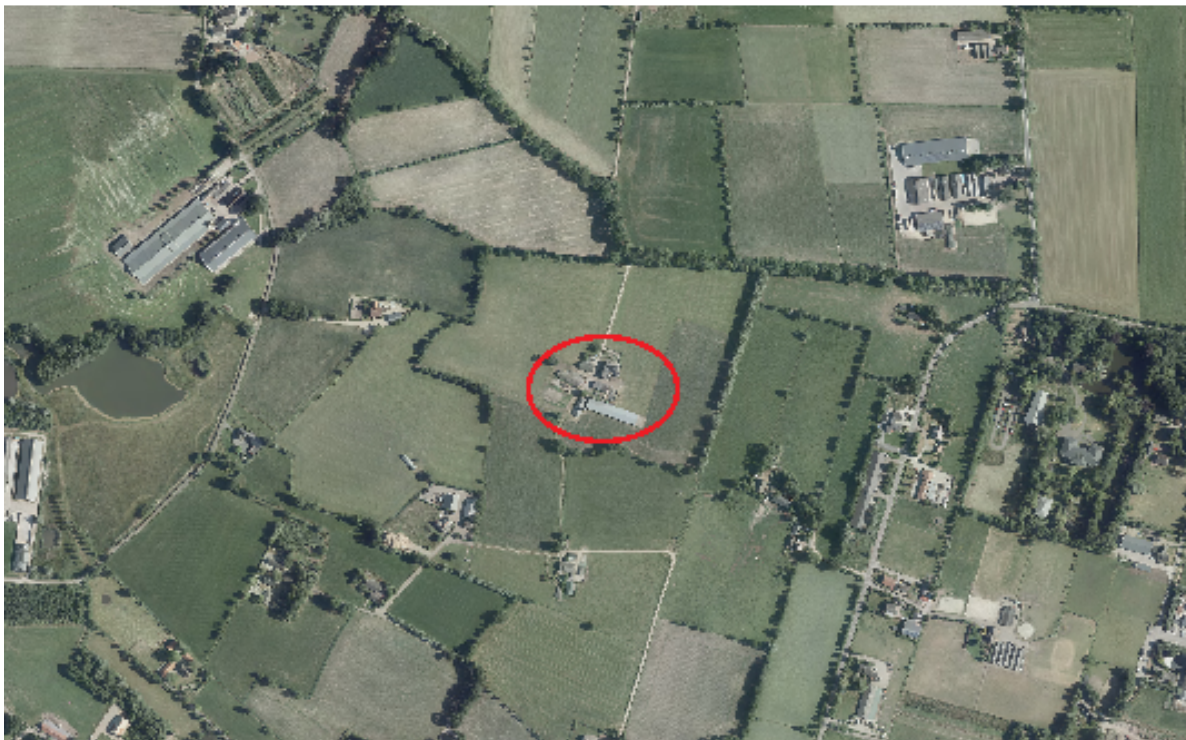
luchtfoto van het betreffende perceel

Het perceel Smalsteeg 2 te Lunteren ligt in het agrarisch buitengebied van de gemeente Ede. De locatie ligt in de directe nabijheid van het kruispunt met het Zwetselaarsepad, circa 1200 meter ten noorden van de bebouwde kom van Ederveen. Kadastraal staat het perceel bekend als gemeente Lunteren, sectie D, nummers 703 en 885.