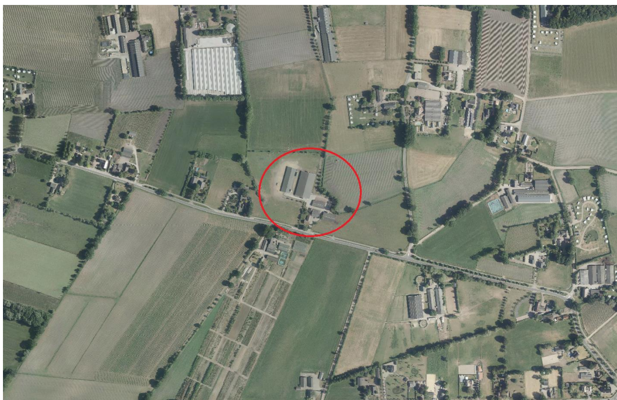
luchtfoto van het betreffende perceel

Het perceel Barneveldseweg 6a te Otterlo ligt in het agrarisch buitengebied van de gemeente Ede. Het perceel ligt in de directe nabijheid van het kruispunt Barneveldseweg - Elzebossenweg, op circa 1200 meter ten noordwesten van de bebouwde kom van Otterlo. Kadastraal staat het perceel bekend als gemeente Otterlo, sectie E, nummers 2687 en 2688.