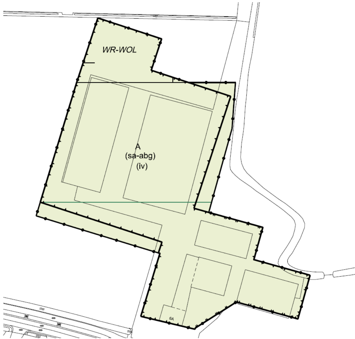
fragment van de toekomstige verbeelding bij het bestemmingsplan