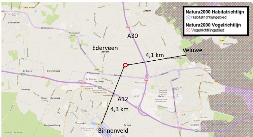
Figuur 2 De planlocatie ligt op een afstand van 4,1 km tot het Natura 2000-gebied Veluwe.