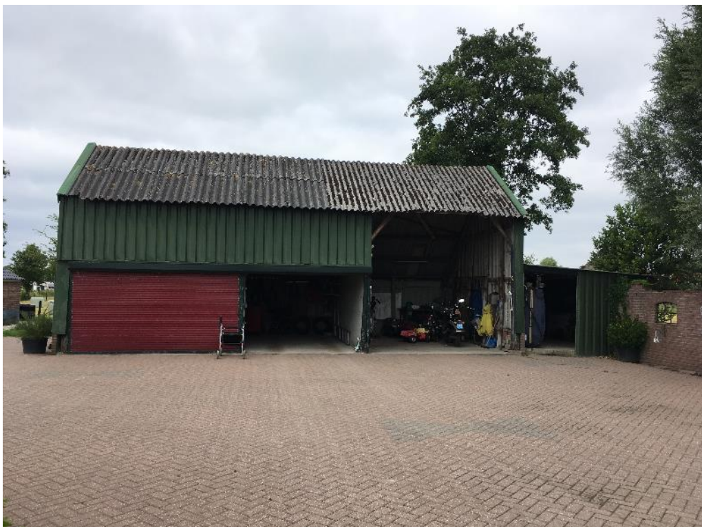
Figuur 2 De schuren zijn opgetrokken uit metalen panelen en hebben een licht hellend plat of zadeldak uit asbest golfplaten.