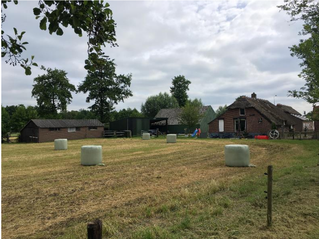
Figuur 1 De planlocatie is gelegen aan de Oudendijk 40 te Ederveen en bestaat uit een boerderijerf waar een tweetal woningen staan en een viertal schuren. De woningen zullen behouden blijven, terwijl de schuren in de beoogde ontwikkelingen gesaneerd worden.