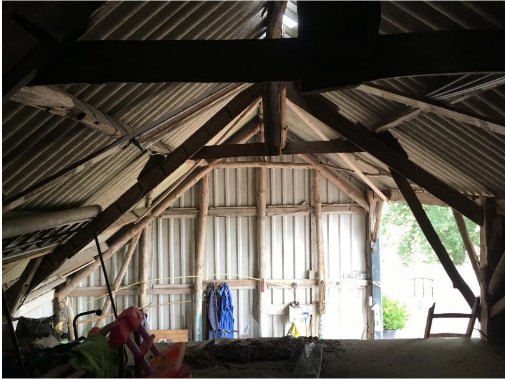
Figuur 3 De grootste schuur is toegankelijk voor uilen. Er zijn echter geen sporen van gebruik of een vaste rust- en verblijfplaats aangetroffen.