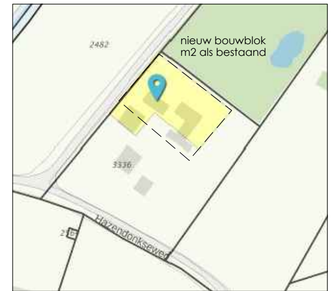
bouwblok - www.ruimtelijkeplannen.nl

nieuwbouw woning inhoud max. 660 m 3 goot max. 4 m l nok max. 9 m l