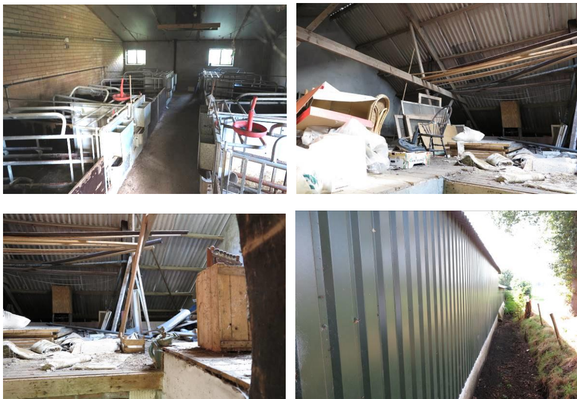
Vervolg figuur 2. Aanzicht van het plangebied Lunterseweg 75 te Ede.