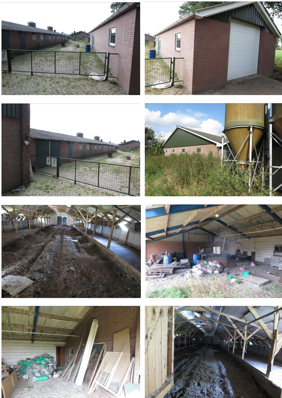
Figuur 2. Aanzicht van het plangebied Lunterseweg 75 te Ede.