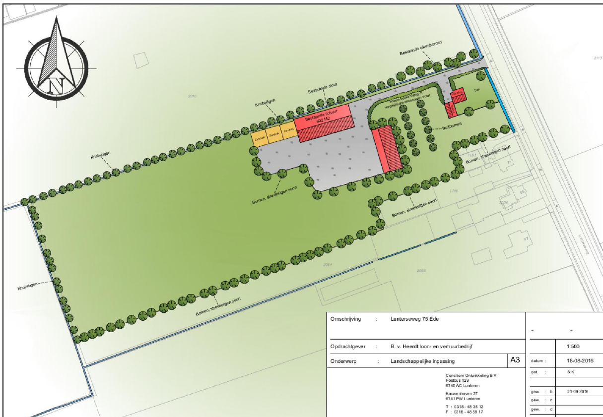
Figuur 3. Impressie van de huidige situatie (boven) en de plannen (onder) aan de Lunterseweg 75 te Ede.