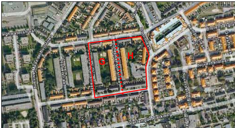
Figuur 1. Ligging van de vlekken G en H

De Uitvindersbuurt maakt deel uit van de wijk Ede-Zuid. Dit betreft één van de eerste uitleggebieden in Ede. Achtereenvolgens zijn in Ede-Zuid de buurten Enkadorp, Uitvindersbuurt en Hoogbouw Ede-Zuid gelegen. De Uitvindersbuurt betreft de locatie die wordt begrensd door de Nieuwe Maanderbuurtweg, de Zanderijweg, de Huygensstraat, de Doornlaan en de bebouwing aan de Verlengde Parkweg. De Uitvindersbuurt is recentelijk grotendeels gehestructureerd. Het totale herontwikkelingsplan voor de Uitvindersbuurt omvat de sloop en nieuwbouw van circa 480 woningen. De herstructurering van de vlekken G en H (zuidoostelijk deel Uitvindersbuurt) is nog niet gerealiseerd. Voor deze vlekken wordt een bestemmingsplanherziening opgesteld. In vlekken G en H worden respectievelijk 70 en 55 woningen gebouwd. De vlekken G en H worden in het noorden begrensd door de Huygensstraat, in het oosten door de Doornlaan, in het zuiden door de Edisonstraat en in het westen door de James Wattstraat. De ligging van de vlekken G en H is weergegeven in figuur 1.