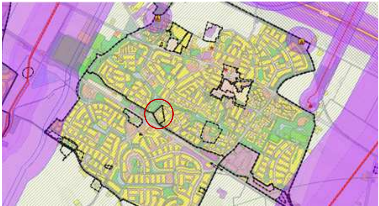
Figuur 1 Uitsnede provinciale risicokaart locatie landgoed Welleveld , 3 aug 2016 (rode cirkel = ligging plangebied)

Op basis van de risicokaart van de provincie Gelderland is een beoordeling gemaakt van de EV-situatie.