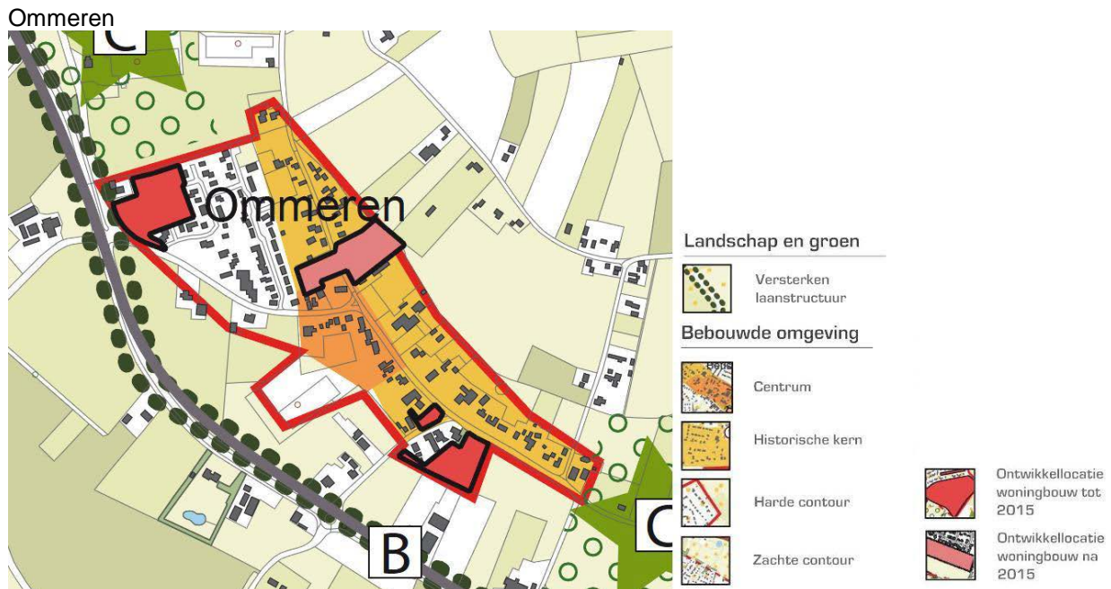
Figuur 4 Verbeelding visie Ommeren

In de kern Ommeren zijn de volgende kenmerken waardevol en dus behoudenswaardig: