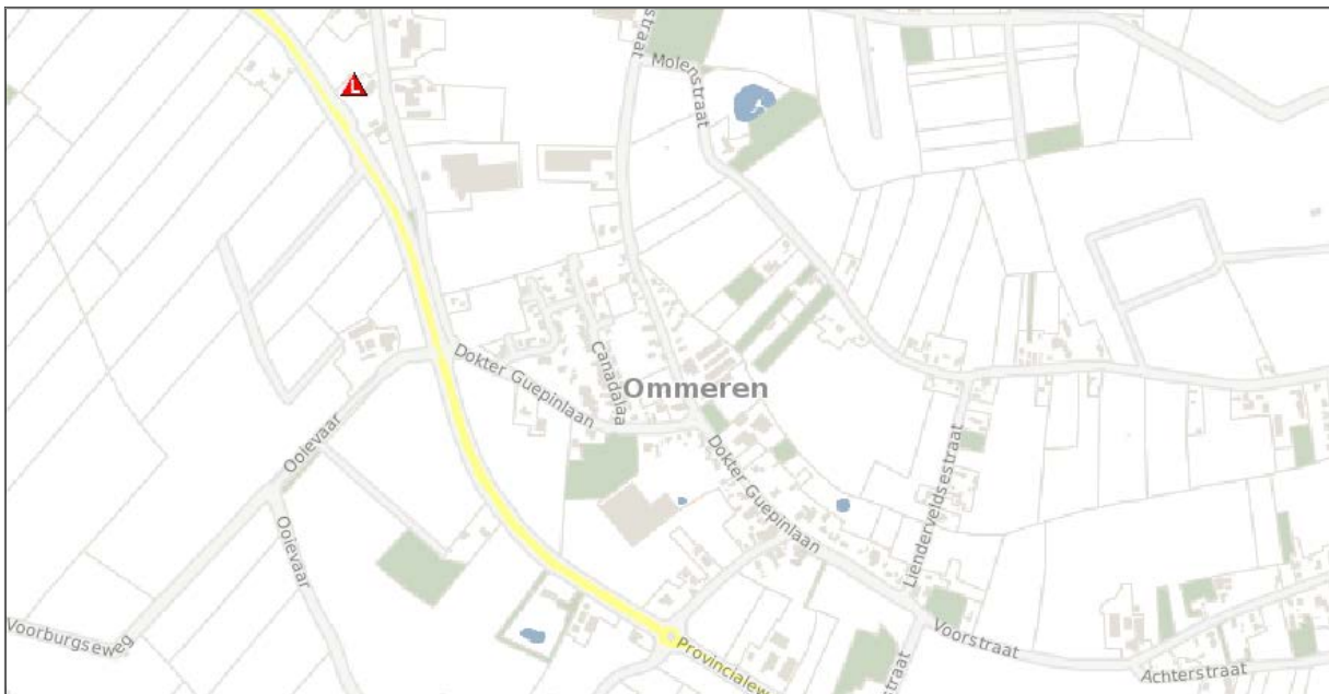
Figuur 5 risicokaart

Op basis van de Risicokaart (zie figuur 5) wordt geconcludeerd dat de dichtstbijzijnde risicobron een LPG-vulpunt is op het perceel De Brei 12. Deze bevindt zich op circa 1.000 meter van het plangebied. Het plangebied ligt niet in de contouren van de veiligheidszones van 500 meter rond het vulpunt, zodat het aspect externe veiligheid dus geen belemmering vormt voor het plan.