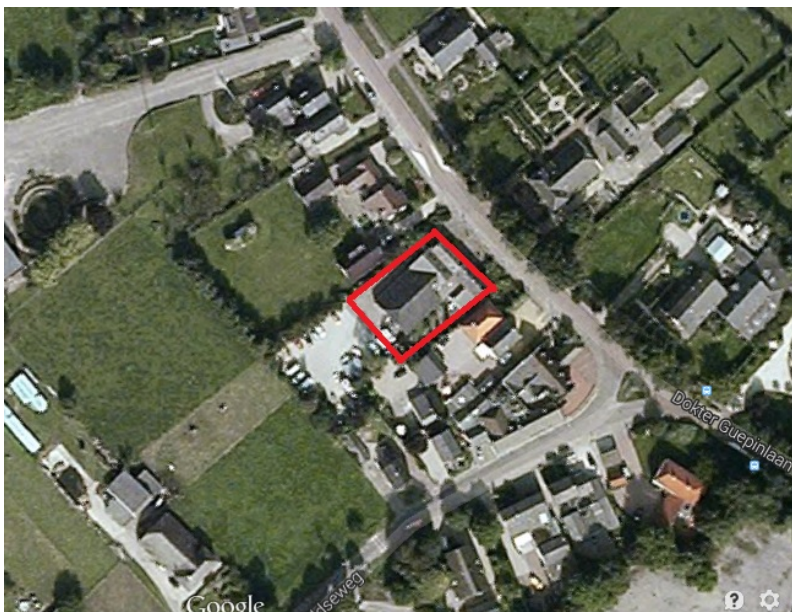
Figuur 1: Globale begrenzing projectgebied

Het projectgebied bevindt zich in het oosten van de kern Ommeren. (Gemeente Buren) en wordt aan de Noordzijde begrensd door de Kerkstraat, aan de oostzijde door de Dr. Guepinlaan, aan de zuidzijde door de Ommerenveldseweg en de provinciale weg de N320 vormt de grens aan westzijde.