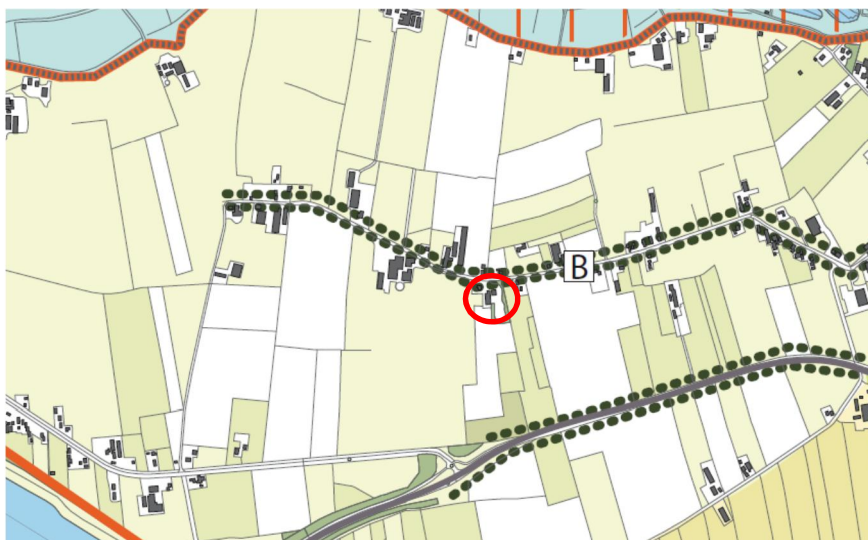
Uitsnede verbeelding structuurvisie

De planlocatie is gelegen op een oeverwal. Het contrast tussen oeverwal en komgronden dient te worden versterkt door aanbrengen van beplanting op de oeverwal. Het streven is om de laanbeplanting langs de Parkstraat te versterken.