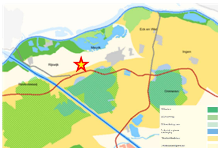
Uitsnede structuurvisie Gelderland: beleidskaart ruimtelijke structuur

In het provinciaal planologisch beleid wordt op deze gebieden geen expliciete provinciale sturing verricht. De vitaliteit van het multifunctionele platteland wordt bevorderd door planologische beleidsvrijheid te geven aan gemeenten gericht op nieuwe economische dragers.