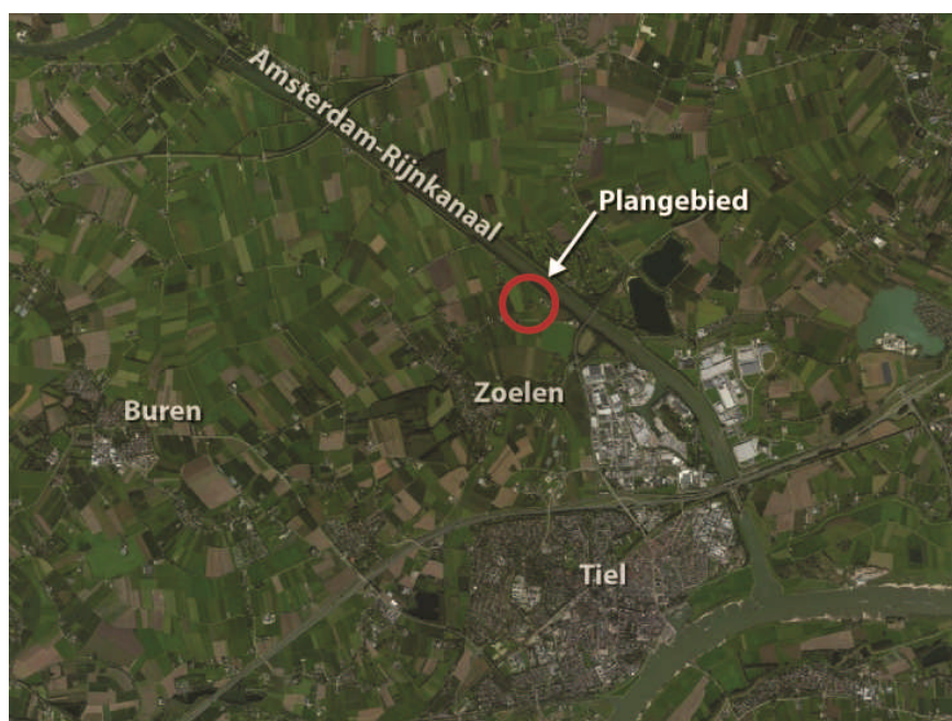
Ligging plangebied in het landschap.

Het plangebied ligt in het buitengebied ten noordwesten van de kern Zoelen, aan de Retsezijstraat. Zoelen ligt op een uiteinde van een stroomrug, dat zich uitstrekt van Beusichem tot Zoelen. Het landschap ter plaatse kan worden omschreven als een half open landschap met gesloten boomgaarden (fruitteelt) en open weidegronden. Hiertussen liggen de linten met boerenbedrijven en woningen(-clusters). De wegen worden vaak begeleid door hagen en bomenrijen op de (boeren)erven. Al rijdend door het buitengebied zorgt dit voor een afwisseling tussen besloten erven en open tussenliggende gebieden. Deze open stukken zorgen voor doorkijkjes naar het achterliggende landschap.