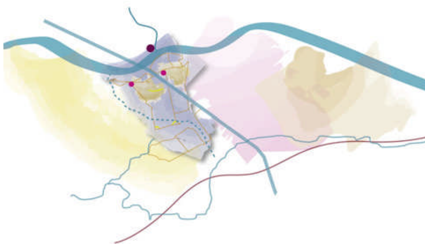
Rijswijk's weidse rivierenlandschap

Het ontwikkelingsplan schetst de ontwikkelingsrichting van verschillende delen van het landschap. Het geeft aan waar nieuwe ontwikkelingen kunnen plaats vinden, waar de openheid voorop moet staan en waar het gebruik van het landschap breder kan worden door recreatie, waterbeheer en natuur toe te voegen. Het plan pleit bovenal om de variatie binnen het landschap te versterken, de banden tussen gebieden te versterken en kwaliteit te stimuleren.