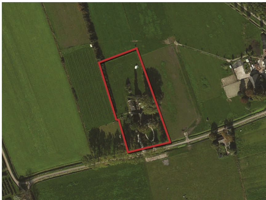
Plangebied rood omkaderd.

Het perceel bestaat uit een buitenwoning met een kleine oprijlaan. Achter de woning staan enkele aan- en bijgebouwen waaronder gebouwen ten behoeve van de camping. Naast het perceel, aan de Retsezijstraat, staat een bomenrij van ongeveer 50 meter. Op het perceel zelf, rondom het buitenhuis, staan enkele solitaire bomen van een fors formaat. Het perceel wordt omgeven door open weidevelden en heeft daarom geen aangrenzende bebouwing.