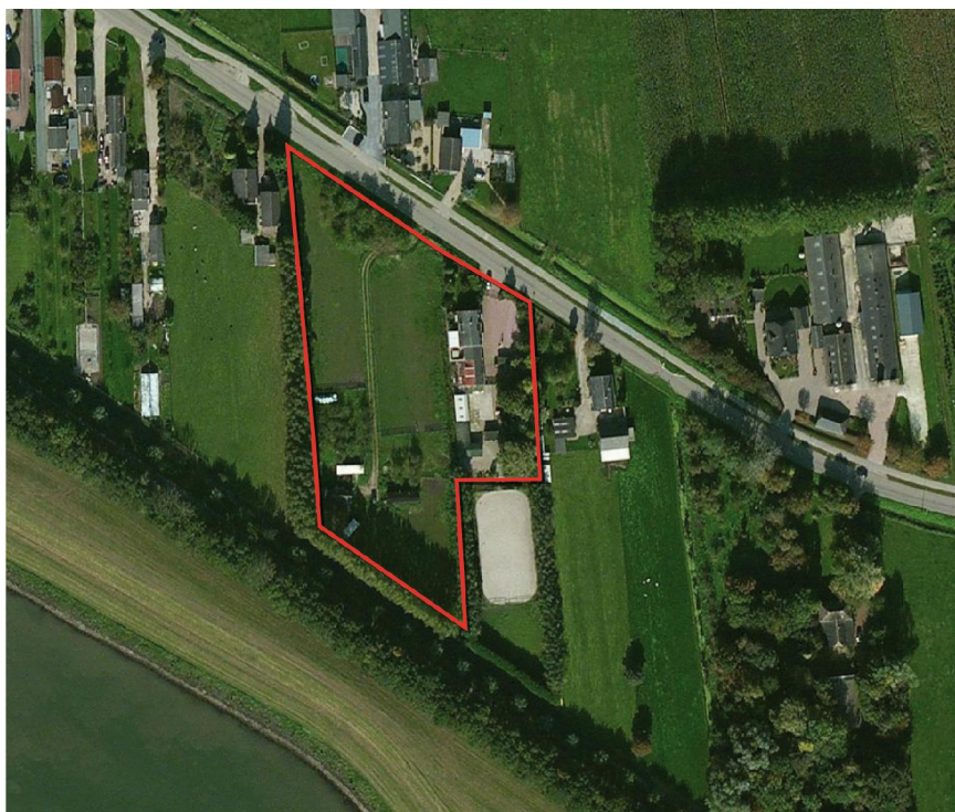
Plangebied rood omkaderd.

De grenzen van het perceel van Heuvel 46 lopen evenwijdig met de verkavelingsstructuur van het landschap. Op het perceel staan verspreid enkele bomen en struwelen. Het zuidelijk deel van het perceel dat aan de Oost Kanaalweg grenst, het gebied waar de maatschappelijke voorziening is geprojecteerd, wordt omzoomd door bomenlanen. De direct aangrenzende percelen ten westen en oosten van dit gedeelte van het perceel zijn agrarisch in gebruik.