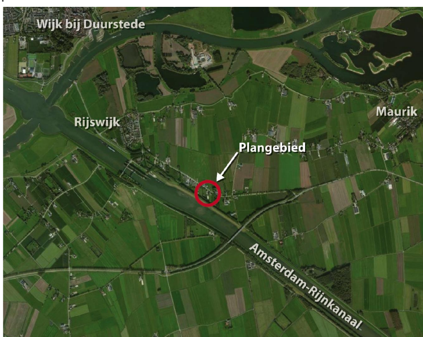
Ligging plangebied in het landschap.

De gras- en weilanden zorgen voor een open landschap, dat een rechtlijnig verkavelingspatroon kent. De wegen in het gebied worden op enkele plaatsen door bomenlanen begeleid, en de openheid van het landschap wordt afgewisseld met dichte bosschages zoals boomgaarden. Het kanaal met de dijken aan weerszijden zorgt voor een dominante scheidingslijn in het landschap.