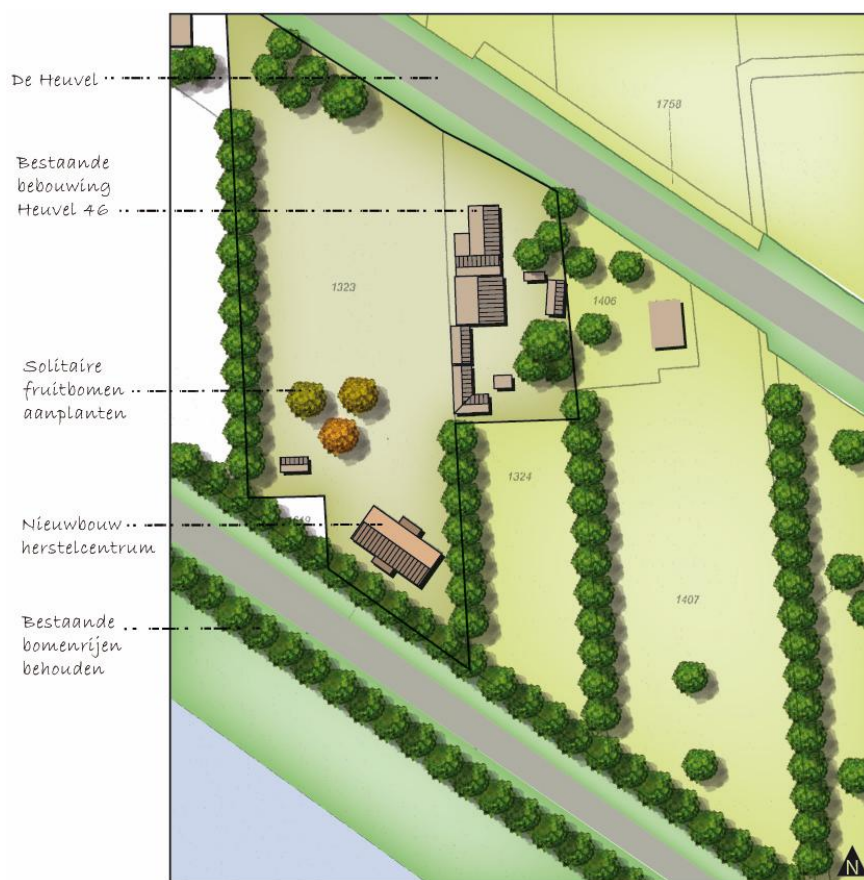
Visualisatie landschapsplan

Er wordt gestreefd naar een behoud van de leesbaarheid van het landschap en waar nodig een versterking ervan. In het beleid van de gemeente komt naar voren dat ontwikkelingen bij bestaande woon- en bedrijfspvormen landschappelijk zorgvuldig ingepast dienen te worden. Ook dienen landschappelijke elementen die bij de ontwikkelingen verloren gaan gecompenseerd te worden. Op onderstaande erfinrichtingschets is te zien hoe het plangebied er globaal uit komt te zien. Daaronder worden de diverse onderdelen van het plan toegelicht.