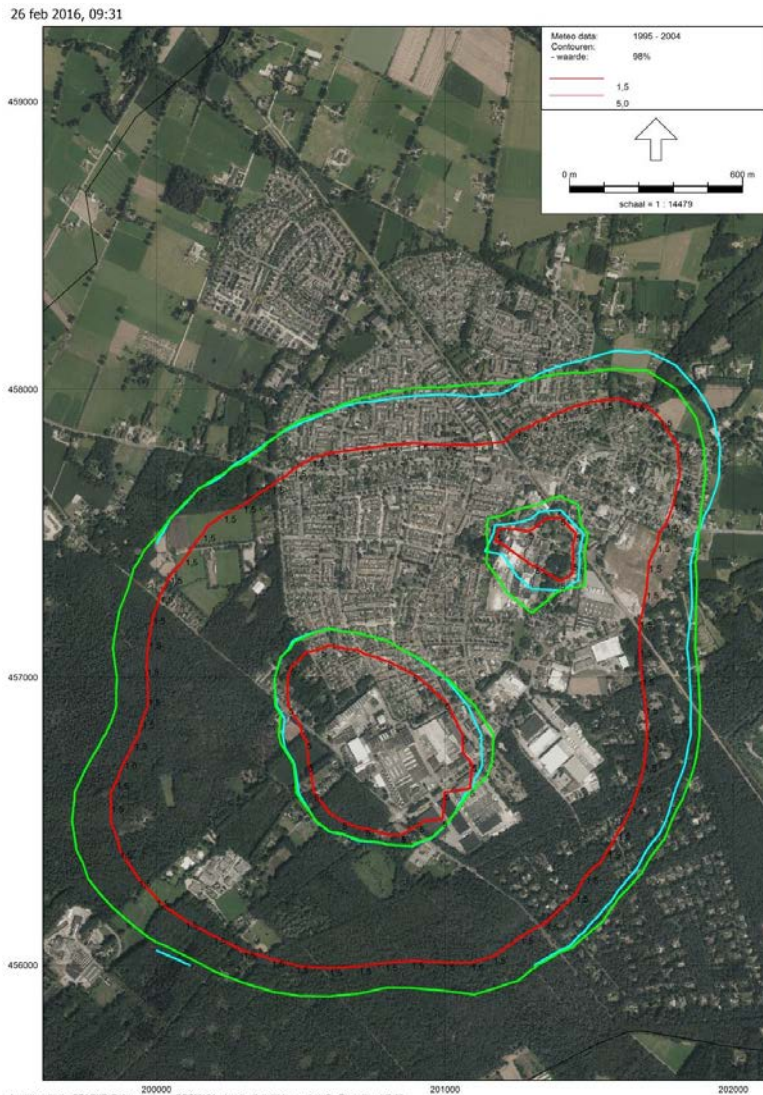
Figuur 2: geurcontouren papierindustrie

De zone 1 tot en met 6 zijn gerelateerd aan de gecumuleerde vergunde geurbelasting van de papierindustrie. De werkelijke geurbelasting was in 2015 beperkt lager. Dit blijkt uit de Notitie "vergunde versus actuele geurbelasting" van Olfasense van 1 maart 2016 (kenmerk 20160301DSSM), waarin onderstaand figuur 2 is opgenomen.