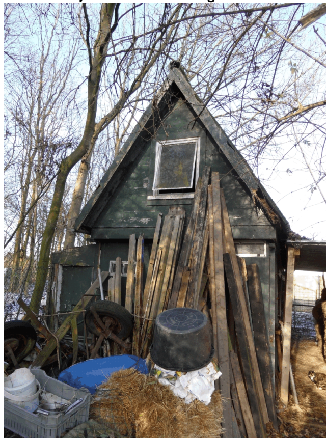
Het schuurtje vanuit het zuiden gezien

Door de ingreep vindt mogelijk verstoring plaats van vaste verblijfplaatsen of vliegroutes van vleermuizen.