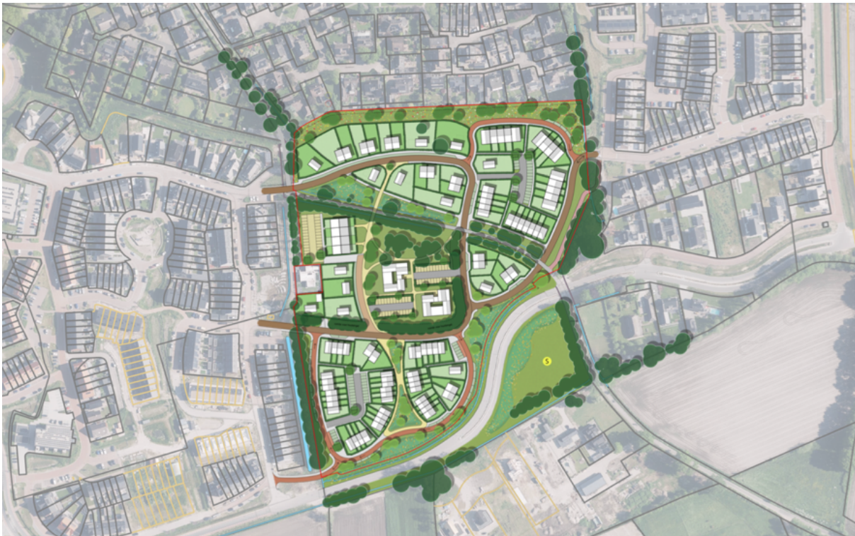
Afb. 1: Kaart plangebied met concept stedenbouwkundige invulling

De planlocatie is gelegen aan en nabij de Schoonengweg 6 en de Holzenboschlaan te Voorthuizen. Zoals gezegd heeft het plangebied een totale grootte van circa 05.27.81 hectare en ligt in de bebouwde kom van Voorthuizen. Aan de noordzijde wordt het plangebied begrensd door de tuinen van woningen aan de Händellaan, ten westen liggen woningen aan de Oostekamp en zuidoosten wordt het plangebied begrensd door de Holzenboschlaan. De stedenbouwkundige invulling ziet er als volgt uit: