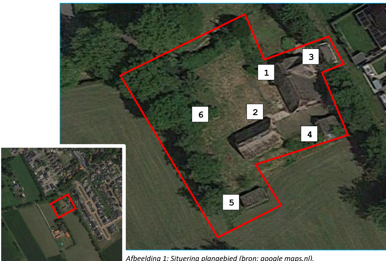
Afbeelding 1: Situering plangebied.

De directe omgeving bestaat uit agrarische percelen en opstallen, groenstructuren en oppervlaktewater.