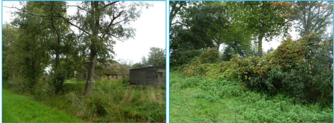
Foto's: Indrukken plangebied. Mogelijk te kappen/ rooien bomen/ struiken.