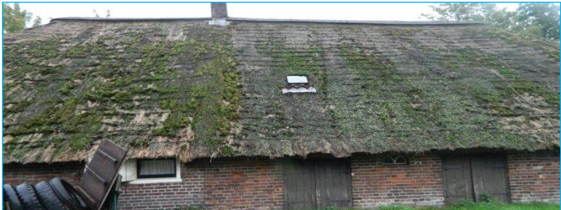
Foto: Indrukken plangebied. Opstal 1. Woonboerderij.