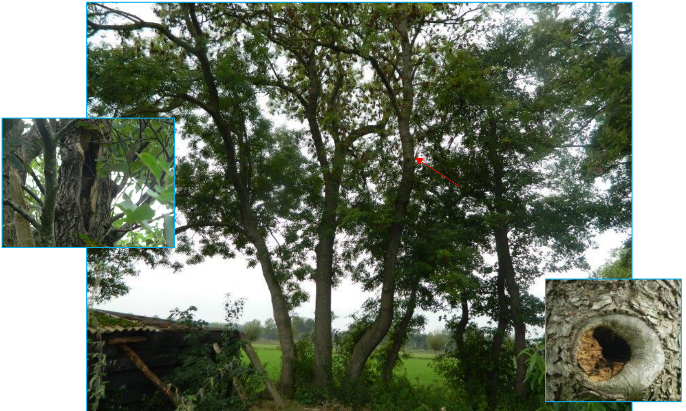
Foto's: Holtes in de mogelijk te kappen bomen mogelijk geschikt voor vleermuizen.

De verwachting is dat er gefoerageerd wordt door vleermuizen binnen het plangebied. Essentiële vliegroutes worden binnen het daadwerkelijke plangebied niet verwacht.