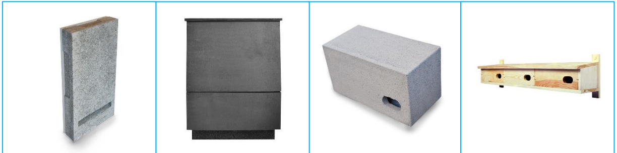
Voorbeelden voorzieningen vleermuizen en gierzwaluw/ huismus.

Het is raadzaam om wel een ecooloog/ ter zake kundige bij aanschaf en plaatsing te betrekken.