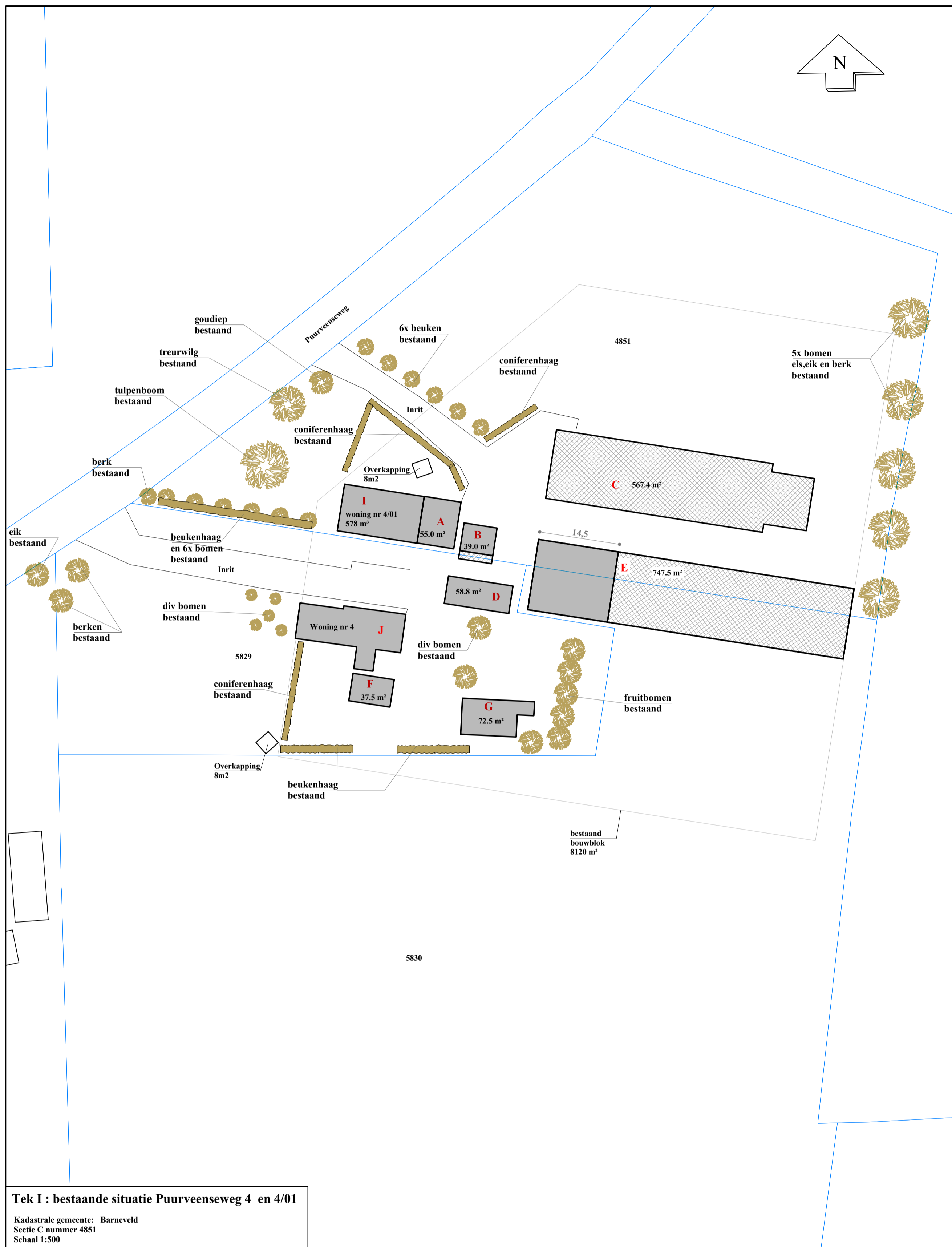
Tek I : bestaande situatie Puurveenseweg 4 en 4/01 Kadastrale gemeente: Barneveld Sectie C nummer 4851 Schaal 1:500