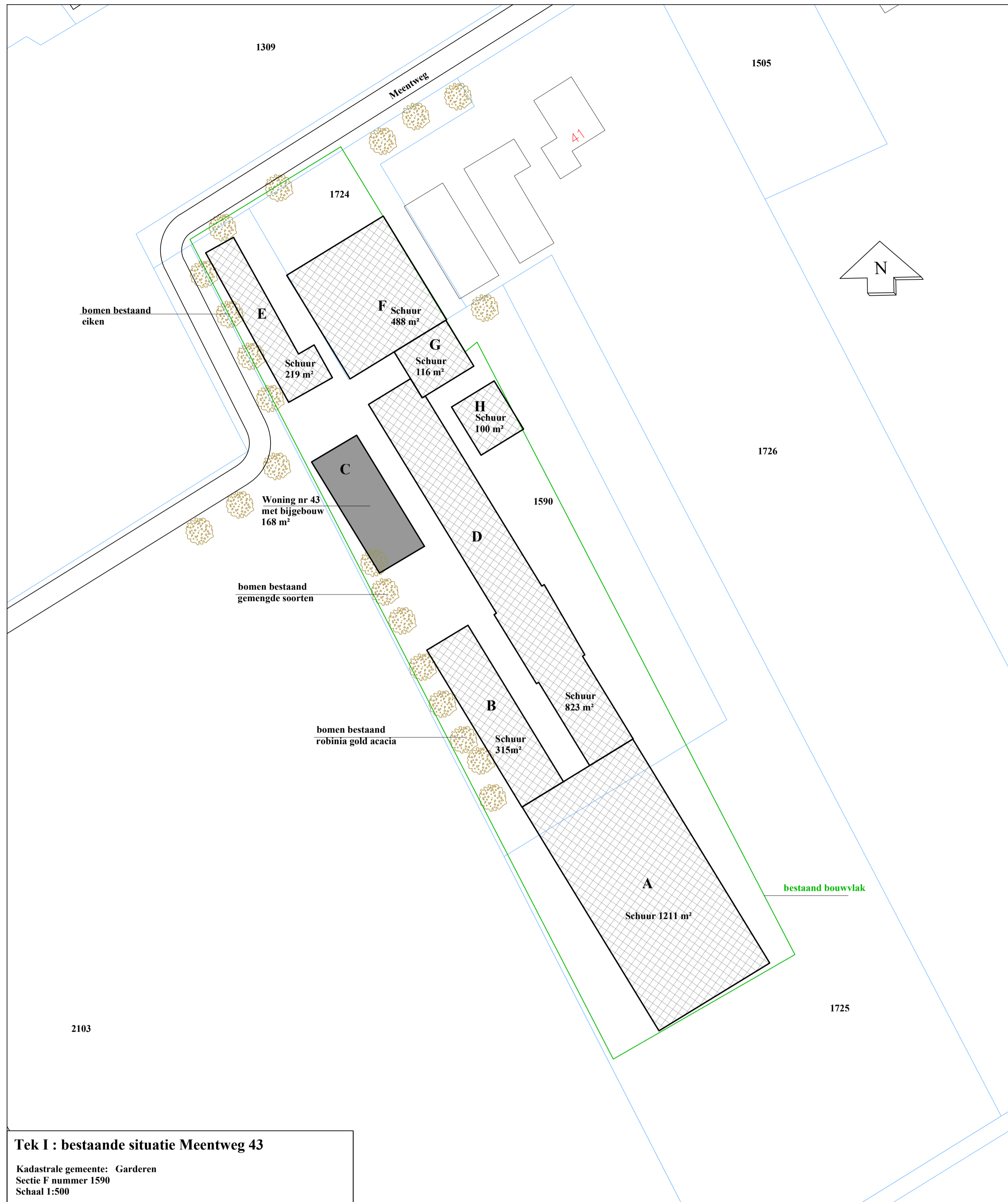
Tek I : bestaande situatie Meentweg 43

Kadastrale gemeente: Garderen Sectie F nummer 1590 Schaal 1:500