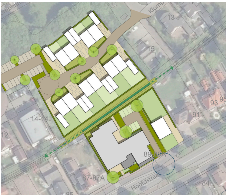
Afb. 1: Kaart plangebied met concept stedenbouwkundige invulling

De planlocatie is gelegen aan de Hoofdstraat 89 te Voorthuizen. Het plangebied heeft een totale grootte van circa 0.56.44 hectare en ligt in de bebouwde kom van Voorthuizen, gelegen aan de doorgaande Hoofdstraat. Het plangebied wordt doorkruist door de drooggelegde 'Ganzebeek'. Aan de noordzijde wordt het plangebied begrensd door een groenstrook en de Mandemakerslaan en Klompenmakerslaan. Het terrein is thans in gebruik als parkeerterrein behorende bij het restaurant Buitenlust.