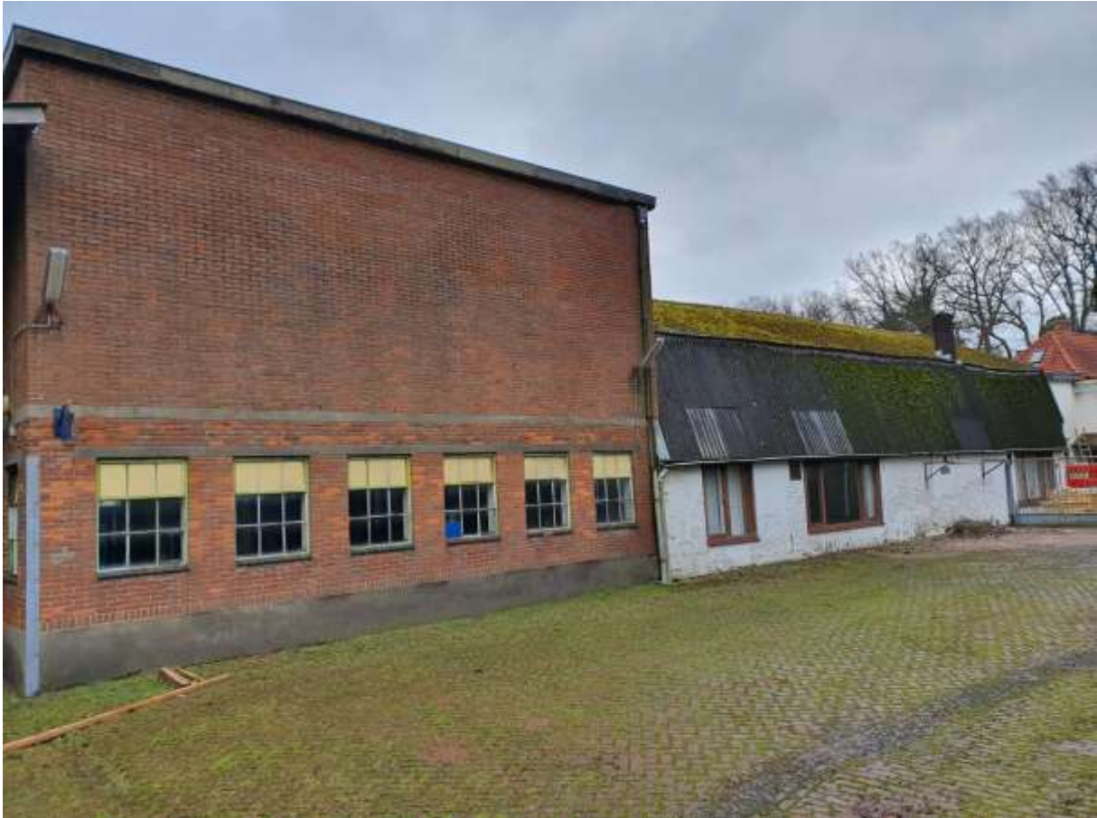
Foto-impressie van de planlocatie

Nader onderzoek gierzwaluw Stationsweg 45 Barneveld