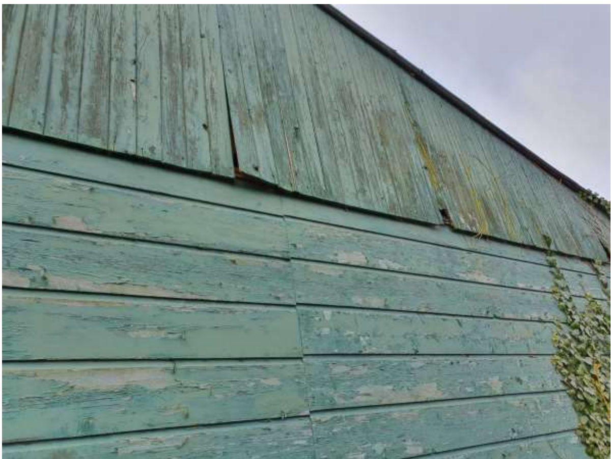
Nader onderzoek gierzwaluw Stationsweg 45 Barneveld