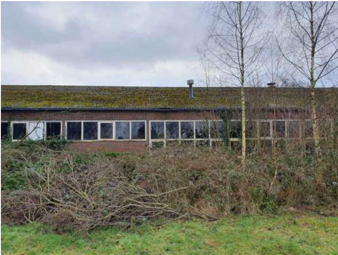
Nader onderzoek gierzwaluw Stationsweg 45 Barneveld