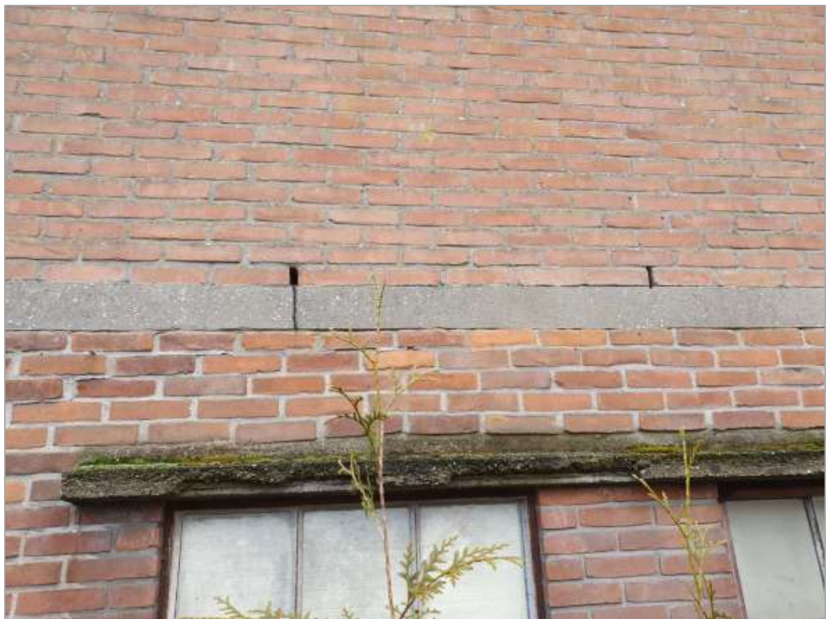
Nader onderzoek gierzwaluw Stationsweg 45 Barneveld