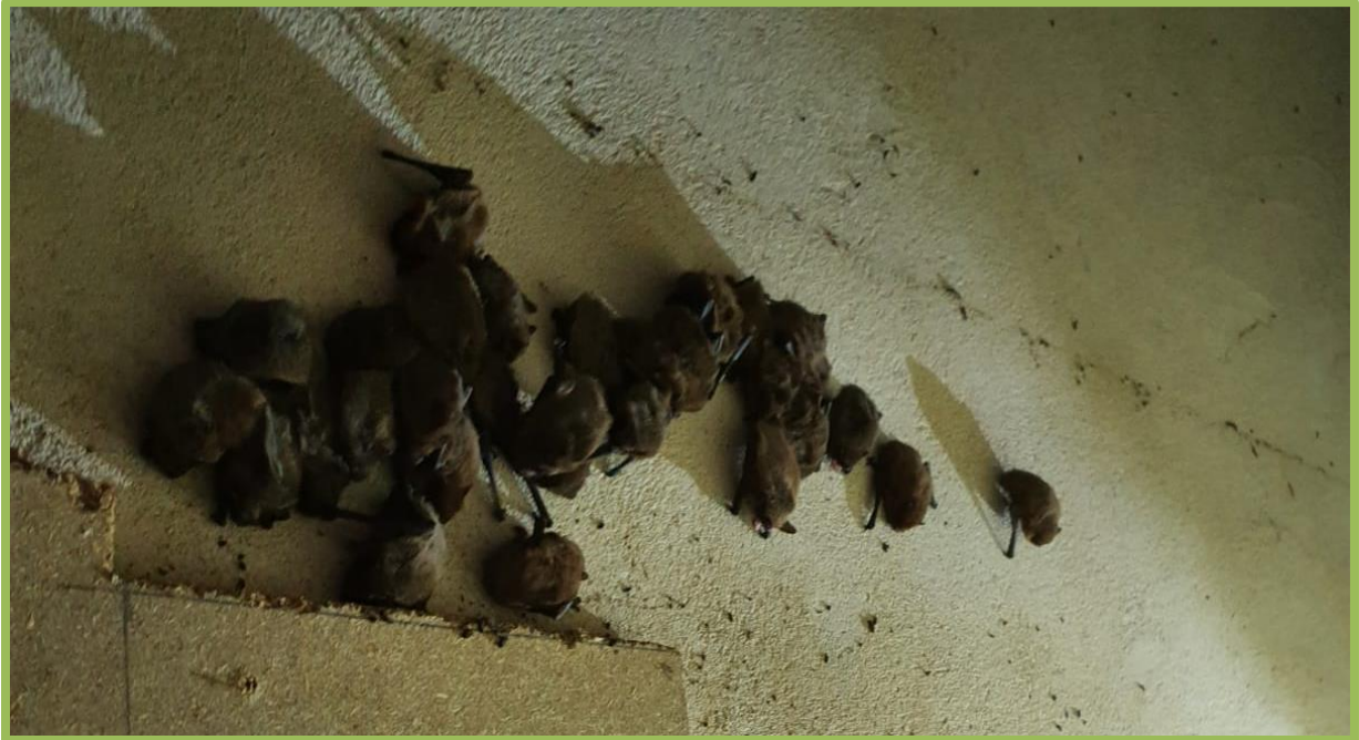
22 gewone dwergvleermuizen in winterrust

Het leefgebied van beschermde vleermuizen (artikel 3.5 Habitatrichtlijn bijlage IV) bestaat uit verblijfplaatsen, vliegroutes en foerageergebieden. In onderstaande tabel worden deze onderdelen nader toegelicht. De bebouwing is onderworpen aan een visuele inspectie. Bij deze ronde tijdens het veldbezoek zijn er holten en spleten waargenomen die mogelijkheden verschaffen voor vleermuizen om in het gebouw te komen. Dit geldt voor zowel het dak en de muur. Er zijn tevens sporen aangetroffen die duiden op aanwezigheid van vleermuizen. De opstallen verschaffen toegang (door hun open karakter). Tijdens het veldbezoek zijn overwinterende vleermuizen aangetroffen in het stenen gebouw achter houten platen die los tegen de wand staan.