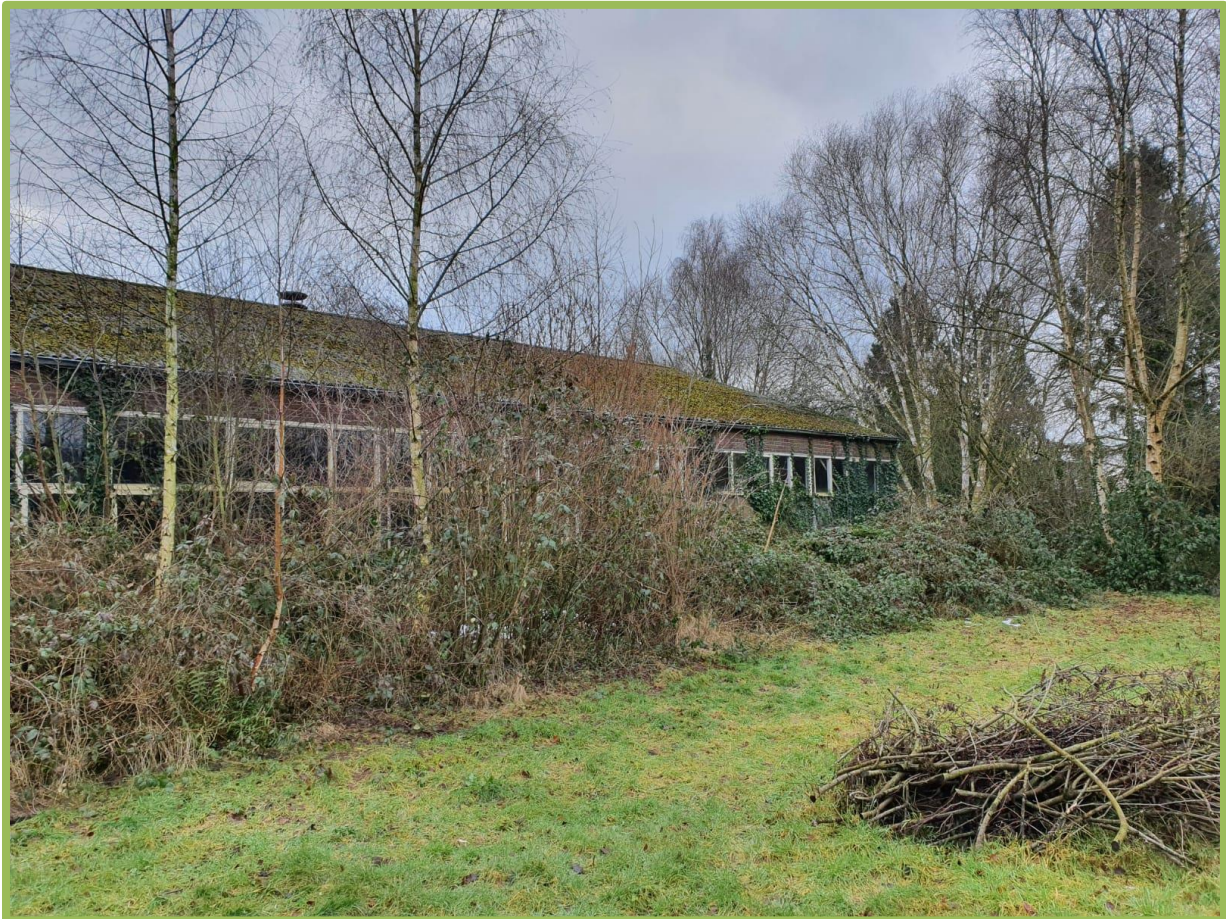
Ruigte met pioniersvegetatie (berk)

Vogelsoorten met vaste rust- en/of verblijfplaatsen zijn binnen het plangebied niet aangetroffen mede vanwege de periode van het onderzoek. Daarom is een potentie-inschatting gemaakt van het habitat. De aanwezige bebouwing is toegankelijk voor vogels door diverse holten en kieren welke toegang verschaffen tot de opstallen om daar een nestplaats te maken. Hierdoor heeft de bebouwing mogelijkheden voor nestplaatsen voor bijvoorbeeld de huismus of de gierzwaluw welke menselijke bebouwing gebruiken als nestplaats.