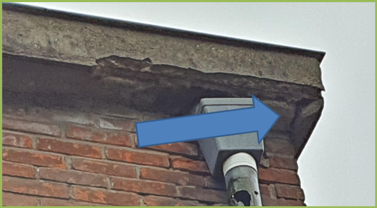
Potentiële holte voor gierwaluw