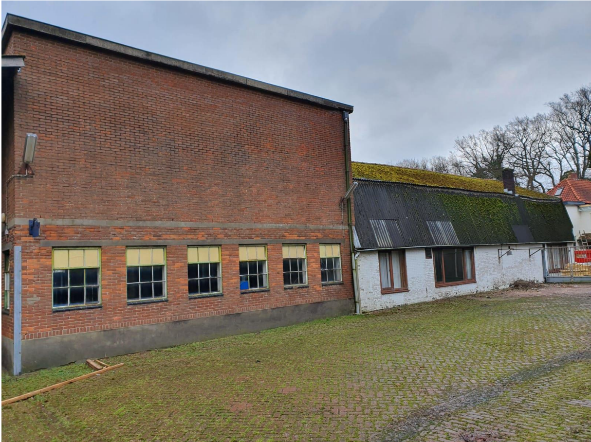
Foto-impressie van de planlocatie