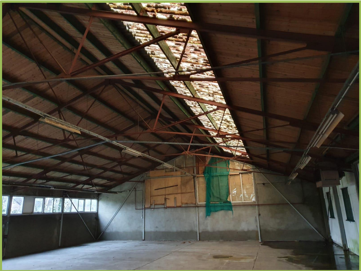
Potentie voor huismus ivm dakbeschoot (en goot)