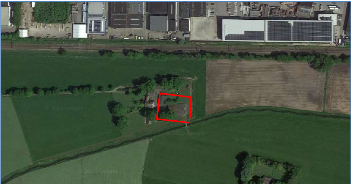
Afbeelding 1 - Globale aanduiding planlocatie

Initiatiefnemer is voornemens om op locatie aan de Buitenhuisweg 6 te Barneveld een nieuwe vrijstaande woning te realiseren. Ten behoeve van de nieuwbouw van deze woning zal er bestaande agrarische bedrijfsbebouwing op locatie worden gesloopt. De nieuwe woning zal een inhoud van 595 m 3 omvatten. In onderstaande afbeelding is de globale planlocatie aangeduid.