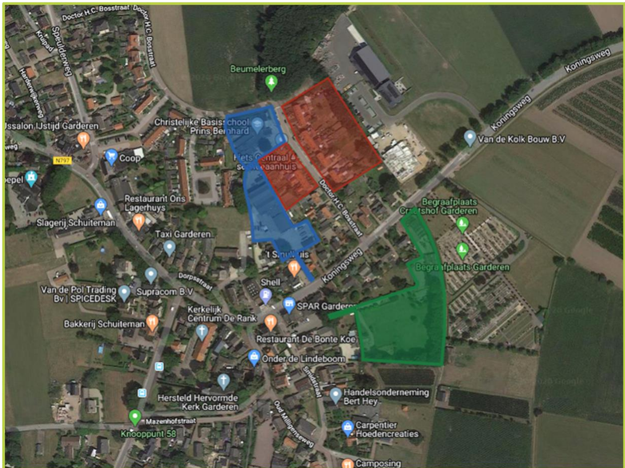
Afbeelding 1: Onderzoeklocaties van QuickScan Garderen Rood = Woningstichting Barneveld Blauw = Van de Kolk Ontwikkeling BV Groen = Van de Kolk Ontwikkeling BV

Het plangebied ligt in de noordoosthoek van de bebouwde kom Garderen en omvat o.a. een groot deel van de Doctor H.C. Bosstraat en tuincentrum Kloezevan aan de Koningsweg 28.