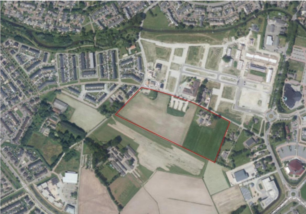
Figuur 2: Globale ligging plangebied (rood gearceerd) ten opzichte van directe omgeving