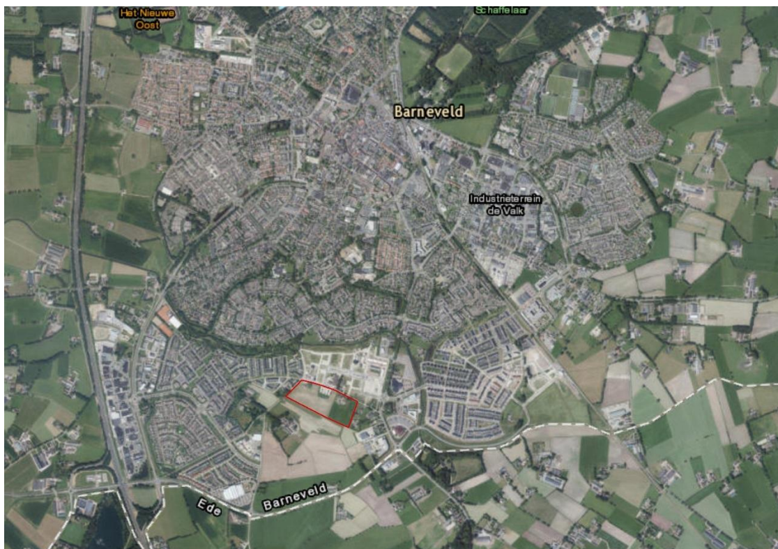
Figuur 1: Globale ligging plangebied (rood gearceerd) ten opzichte van Barneveld en omgeving

Het plangebied van ongeveer vijf hectare ligt in het zuiden van Barneveld (zie figuur 1). In 'Bijlage B Foto-impressie' is een foto-impressie van het plangebied opgenomen. Het gebied is in agrarisch gebruik met een klein parkeerveld tegenover de Ds. J. Fraanje school aan de Nederwoudseweg. Het parkeerveld is van tijdelijke aard en diende als parkeerruimte voor zolang de parkeergelegenheid in de aangrenzende wijk Eilanden-oost nog niet beschikbaar was. Aan de noord- en westzijde grenst het plangebied aan reeds gerealiseerde deelwijken van woonwijk De Burcht met een asfalt weg er tussenin. Aan de oostzijde grenst het gebied aan twee boerderijen. De zuidzijde is door akkerland begrensd (zie figuur 2).