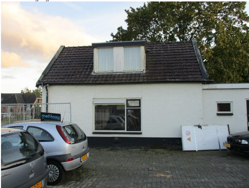
Figuur 2 De woning binnen de planlocatie.