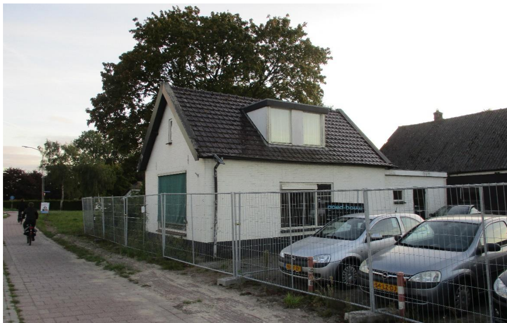
Figuur 2 Fotografische indruk van de planlocatie.