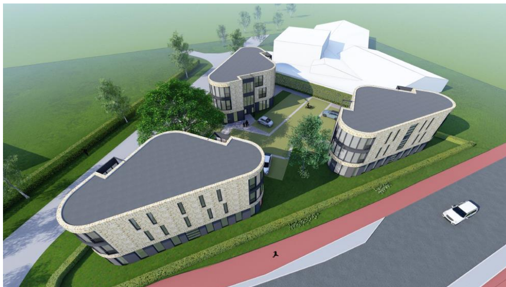
Figuur 3 Visuele representatie van de beoogde situatie (bron: 3N30 Architecten).