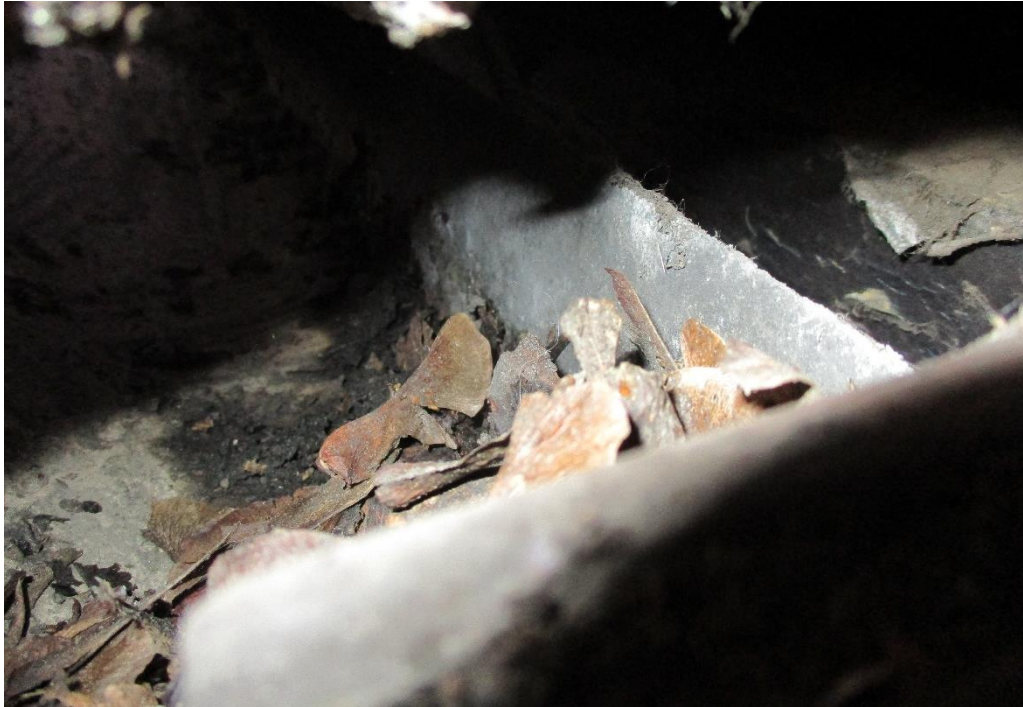
Figuur 4 Plastic opstand onder de dakpannen van de woning die de toegang voor huismussen verhindert.

De gierzwaluw leeft evenals de huismus in de directe omgeving van mensen en broedt tevens als koloniebroeder in gevels en onder (pannen)daken (BIJ12 kennisdocument Gierzwaluw, 2017). De soort is vaak te vinden in woonwijken en is vrij zeldzaam in landelijk gebied. In zowel de woning als de garage zijn geen geschikte invliegopeningen aangetroffen voor de gierzwaluw. Hierdoor kan de aanwezigheid van gierzwaluw op de planlocatie uitgesloten worden. Van overtreding van verbodsbepalingen ten aanzien van jaarrond beschermde nestlocaties en essentiële habitatonderdelen is geen sprake.