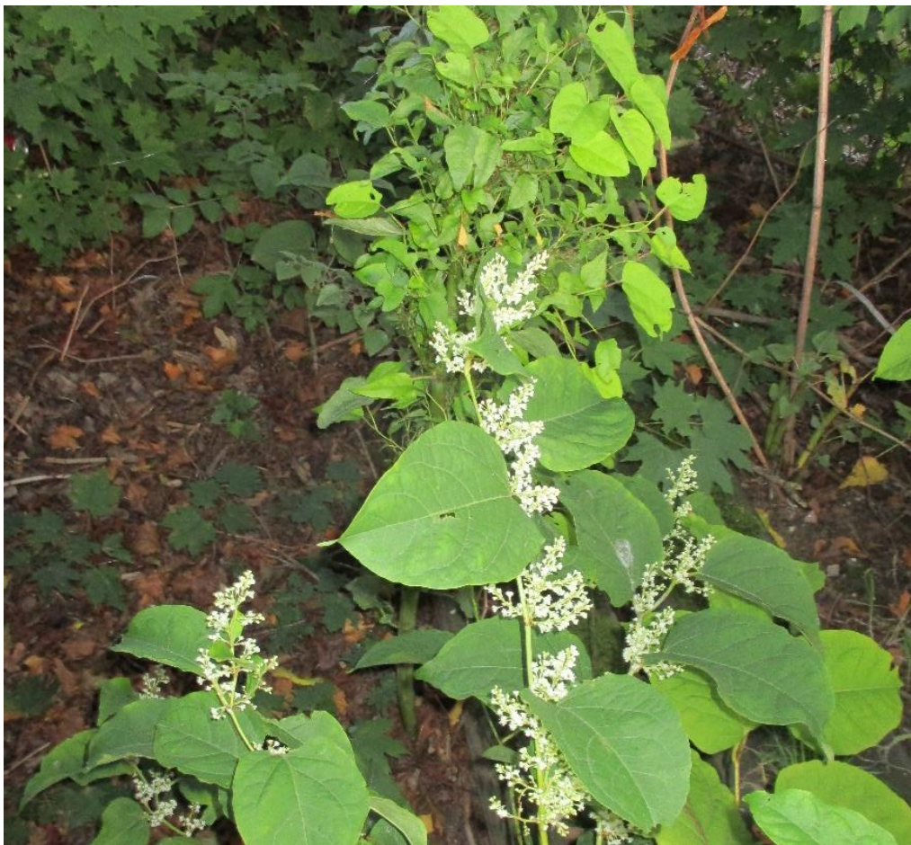
Figuur 4 Te zuiden van de woning is Japanse duizendknoop aangetroffen, een zeer invasieve plant. Hierdoor dienen maatregelen getroffen te worden.