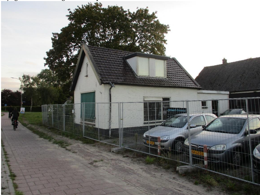
Figuur 1 De planlocatie is gelegen aan de Baron van Nagellstraat 92 en bestaat uit een grasveld, woning en garage.