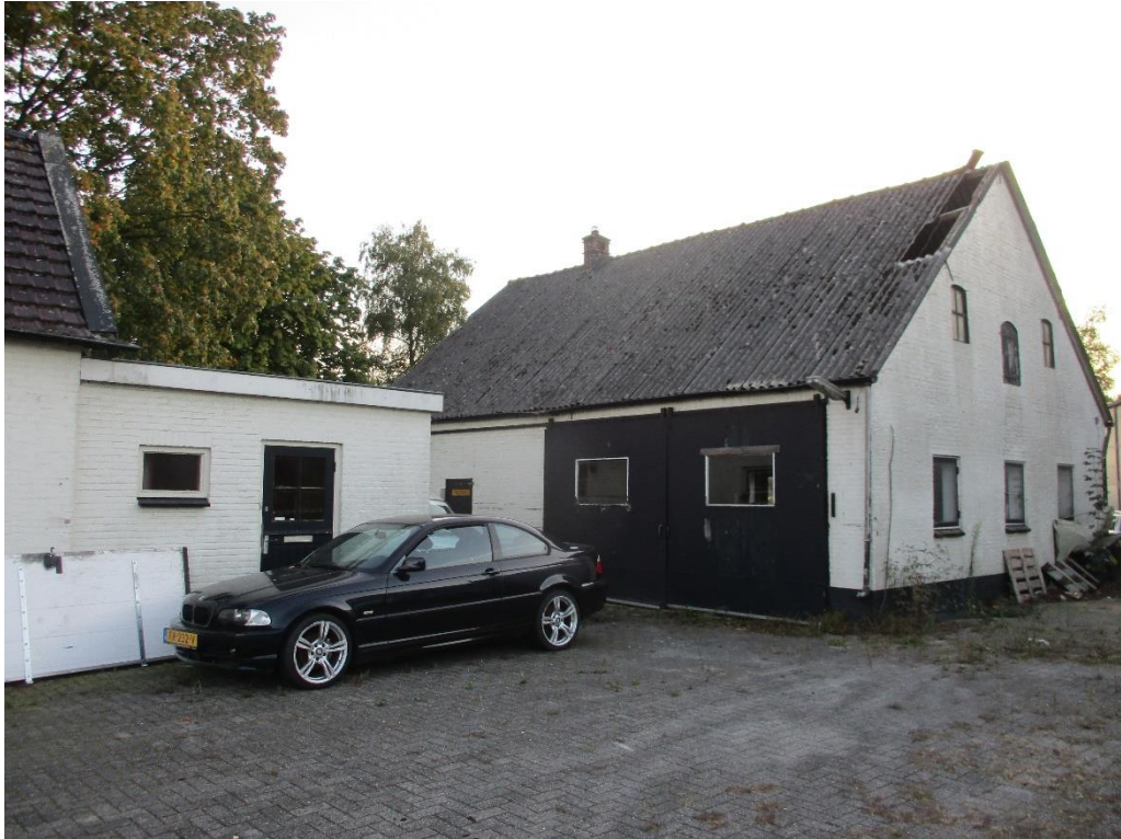
Figuur 3 De aanbouw van de woning (links) en garage (rechts) binnen de planlocatie.