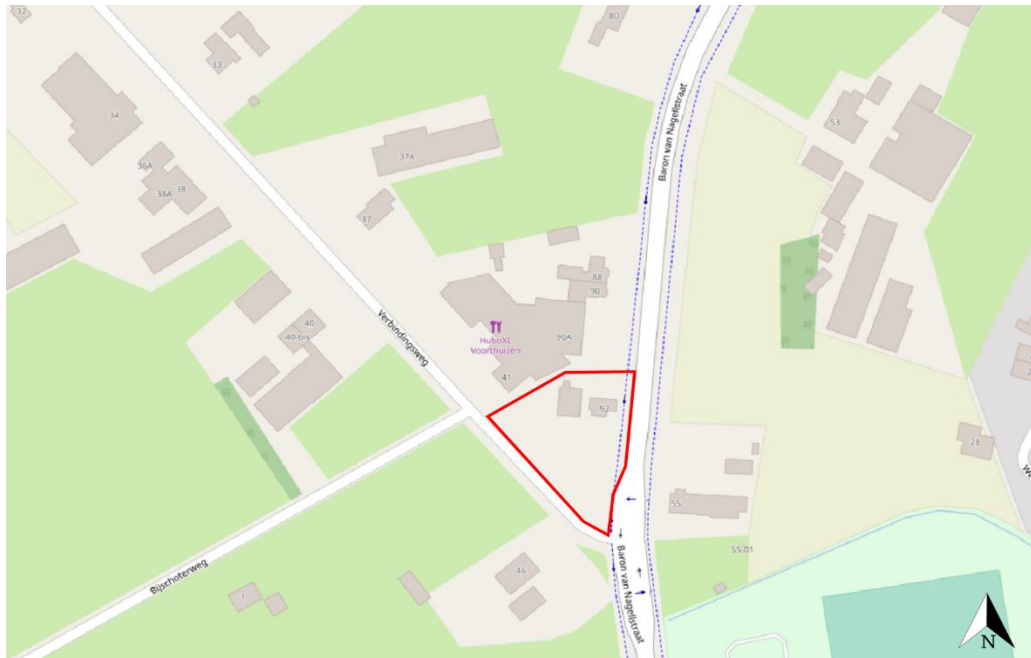
Figuur 1 De planlocatie (rood omkaderd) is gelegen aan de Baron van Nagellstraat 92.

De directe omgeving van de planlocatie wordt gekenmerkt door een agrarische omgeving met akkers, weilanden, vrijstaande woningen en enkele bosschages. De planlocatie ligt ca. 800 m ten noorden van de snelweg A1 en ca. 1,2 km ten noordwesten van de plas Zeumeren.