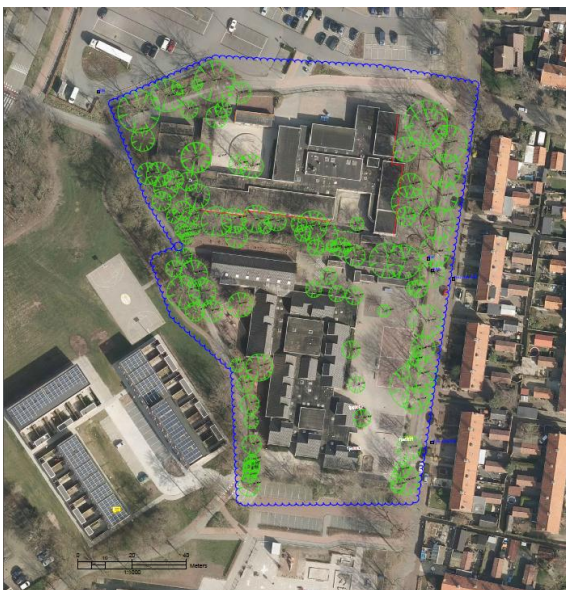
Figuur 5: Inventarisatie omliggende bomen plangebied Lijsterstraat.

Beide gebouwen dienen gesloopt te worden, met een jaar ertussen, waarbij mogelijk een aantal van de omliggende bomen gekapt wordt, Figuur 5.