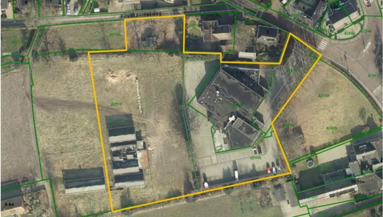
Figuur 6. De projectlocatie aan de Putterweg 1 in Garderen.

Het plangebied aan de Putterweg 1 in Garderen bestaat uit het oude dorpshuis, omringd door enkele laanbomen en uitkijkend op vrij open, agrarisch landschap. Het dorpshuis zelf is aan vervanging toe; nu is het een vierkant gebouw met een plat dak en bakstenen muren.