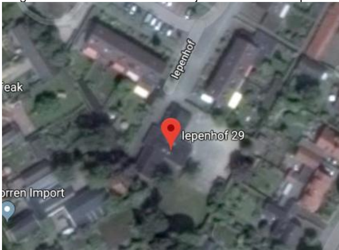
Figuur 3. Overzicht van het kinderdagverblijf aan de Iepenhof in Barneveld.

Het kinderdagverblijf aan de Iepenhof in Barneveld is een vrij klein grondgebonden, vierkant, bakstenen gebouw. Het kinderdagverblijf ligt in dezelfde groene woonwijk als de Koningin Julianaschool. Het ligt enigszins achteraf in een woonwijk aan een doodlopende weg.