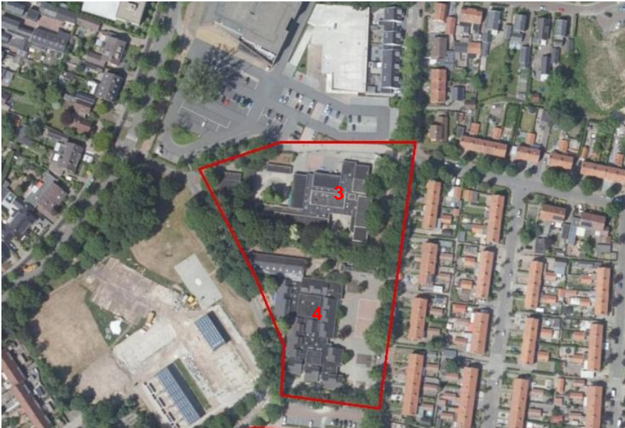
Figuur 4. Schoolgebouwen aan de Lijsterstraat in Barneveld.

De Eben-Haëzerschool (3) en de voormalige locatie van de Ds. J. Fraanjeschool (4) aan de Lijsterstraat in Barneveld staan naast elkaar, om deze reden zijn beide gebouwen samengenomen als een plangebied. Het plangebied bestaat uit twee oude schoolgebouwen, beide vierkante gebouwen met deels platte daken. De Ds. J. Fraanjeschool heeft ook schuine daken met dakpannen. Rondom beide gebouwen staan diverse inheemse volgroeide bomen van enige leeftijd.