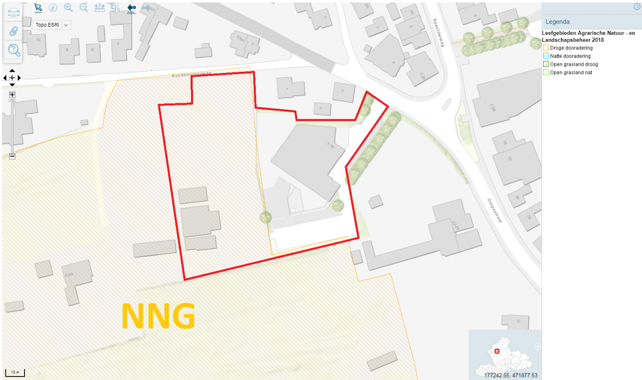
Figuur 7: Dorps huis Garderen (rood omlijnd) ten opzichte van het natuurnetwerk Gelderland (NNG).

Het perceel overlapt het natuurnetwerk van Gelderland en bevindt zich op circa 200 meter afstand van Natura 2000-gebied de Veluwe, Figuur 7 en Figuur 8.