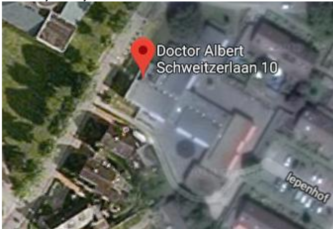
Figuur 2. Locatie van de school aan de Dr. Albert Schweitzerlaan in Barneveld.

De Koningin Julianaschool aan de Dr. Albert Schweitzerlaan in Barneveld is een grondgebonden, vierkant, bakstenen gebouw met boeiboorden en omgeven met bomenrijen. De school ligt middenin een vrij groene woonwijk nabij het Oosterbos.