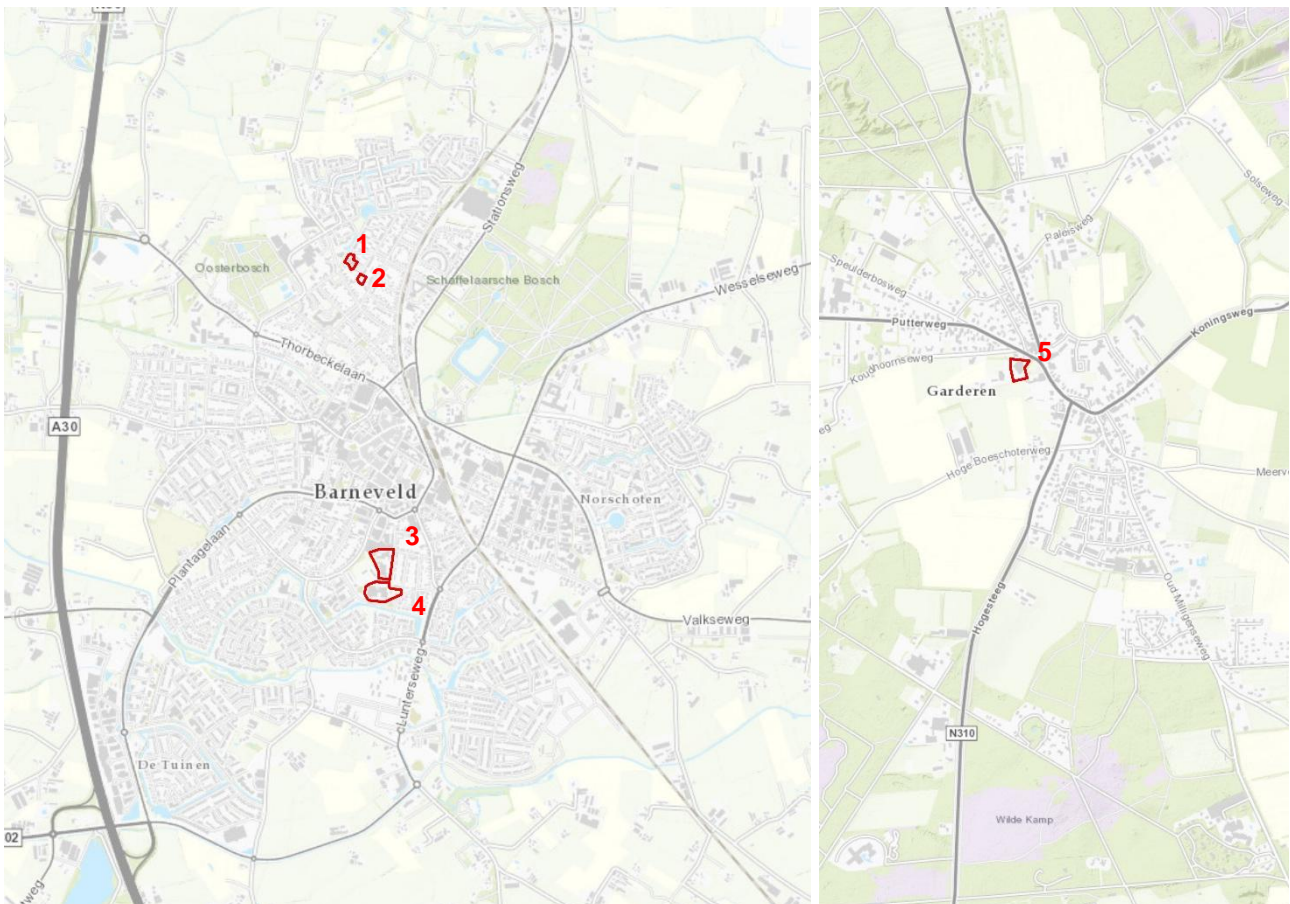
Figuur 1: Kaartweergave te slopen gebouwen. 1) Koningin Julianaschool, 2) Kinderdagverblijf, 3) Eben-Haëzerschool, 4) Fraanjeschool, 5) Dorps huis.

De gemeente Barneveld is voornemens om op drie verschillende locaties projecten te gaan starten, zijnde het slopen een vijftal gebouwen: van de Koningin Julianaschool aan de Dr. Albert Schweitzerlaan in Barneveld (1), de sloop van een kinderdagverblijf aan de Iepenhof in Barneveld (2) en het herontwikkelen van de Eben-Haëzerschool (3) en de voormalige Ds. J. Fraanjeschool (4) aan de Lijsterstraat in Barneveld, alsmede het slopen van het dorps huis aan de Putterweg in Garderen (5), Figuur 1.