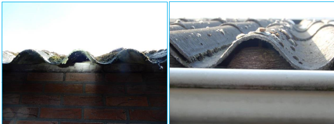
Foto's: Goed te onderzoeken golfplaten en dichtgemaakte openingen.

De te amoveren opstallen zijn goed onderzocht op nesten en sporen van deze soort. De daken van de stallen waren door de geringe hoogte goed te onderzoeken. Er zijn geen nestresten of sporen van huismus waargenomen. Een deel van de golfplatendaken is vogeldicht gemaakt. Er zijn weinig groenstructuren aanwezig rondom de opstallen waarin deze soort kan schuilen.