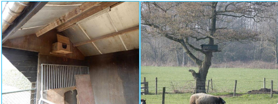
Foto's: Kerkuilenkast op erf en steenuilenkast in weide overzijde Puurveenseweg.

In de 2011 geplaatste kerkuilenkast in de paardenstal broedt volgens de initiatiefnemer geen kerkuil, alleen duiven. Er zijn ook geen sporen van kerkuil aangetroffen daar. Aan de overzijde van de weg hangt in een boom een steenuilenkast.