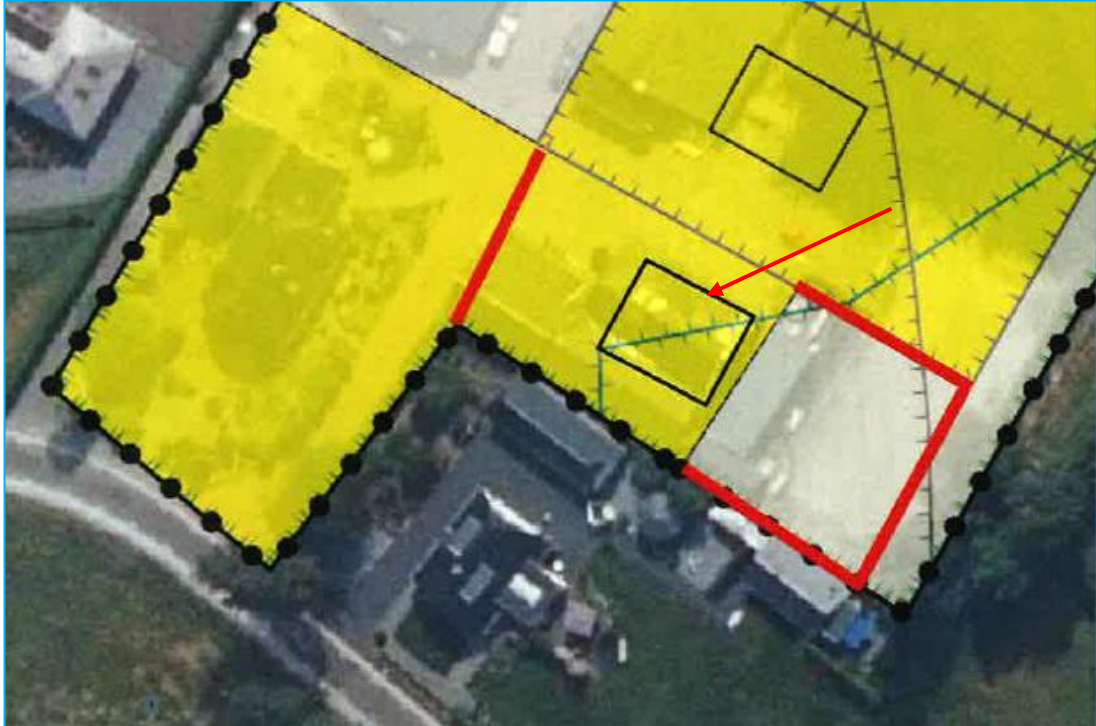
Afbeelding 2: Indruk gewenste situatie.

De ingrepen vinden plaats in het kader van ruimtelijke inrichting of ontwikkeling van gebieden.