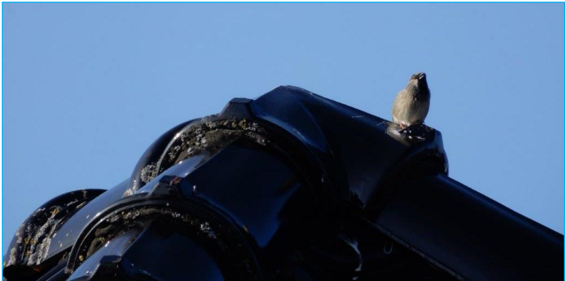
Foto: Zingend mannetje dak woning nummer 26.

Tijdens het veldbezoek zijn binnen het daadwerkelijke plangebied en de omgeving diverse vogels waargenomen zoals ekster, koolmees, houtduif, kauw, buizerd (in de lucht) en een enkel exemplaar van de huismus. De huismus is binnen het daadwerkelijke plangebied gedurende het ruim twee uur durende onderzoek geen enkele keer waargenomen. Het waargenomen exemplaar betrof een zingend mannetje op het dak van woning met huisnummer 26. Bij het erf aan de overzijde van de Puurveenseweg zijn eveneens auditief exemplaren waargenomen.