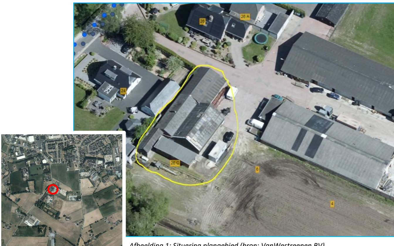
Afbeelding 1: Situering plangebied.

Het plangebied is gelegen ten zuiden van de bebouwde kern van Kootwijkerbroek en betreft diverse opstallen nabij Puurveenseweg 26. De opstallen bestaan uit een overkapping, woonunit en oude stallen die als werkplaats/ opslagplaats worden gebruikt. De directe omgeving bestaat uit agrarische percelen.