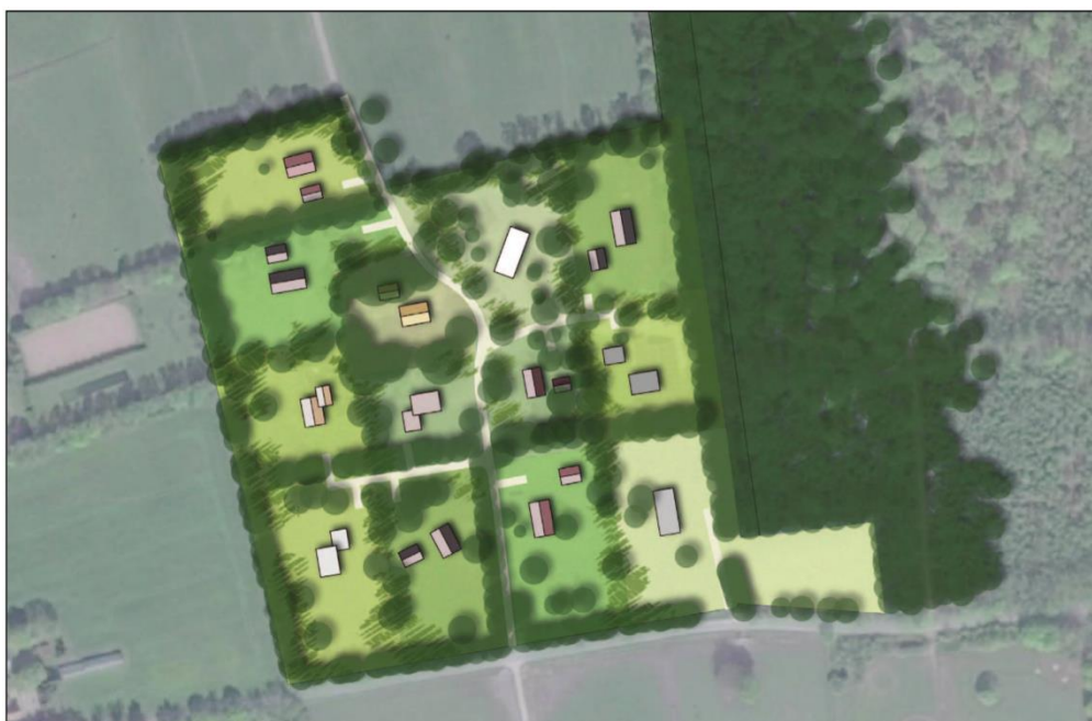
Afbeelding 1.2 Schets beoogde situatie plangebied