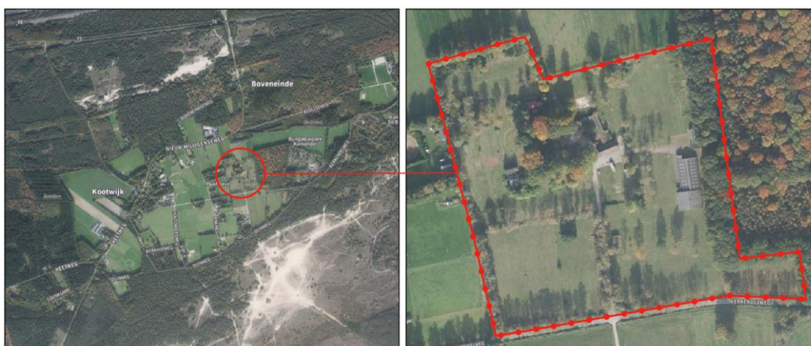
Afbeelding 1.1 Ligging van het plangebied

In deze quickscan zijn de risicobronnen geïventariseerd en is beoordeeld of de genoemde risicobronnen mogelijk een belemmering vormen voor de invulling van het plangebied. Indien risicobronnen een mogelijke belemmering vormen, is een vervolgonderzoek noodzakelijk.