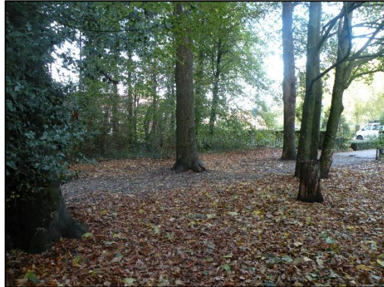
Gebied toekomstig parkeren