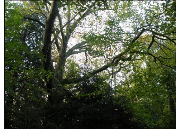
Ver uitgroeijende tak boom 86