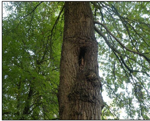
Holte in eik boom 1