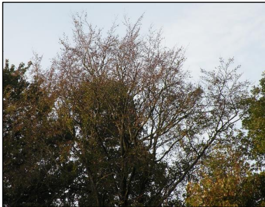
Droogteschade in top beuk (4)