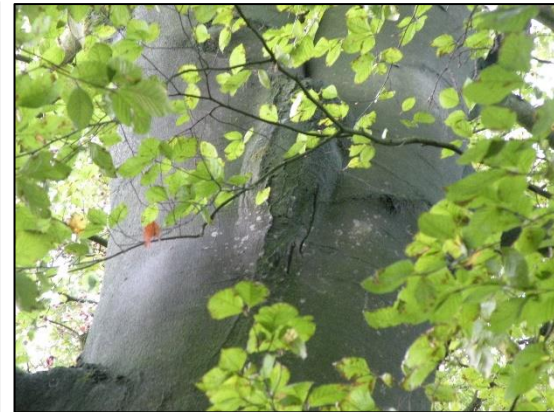
Plakksel in beuk boom 4