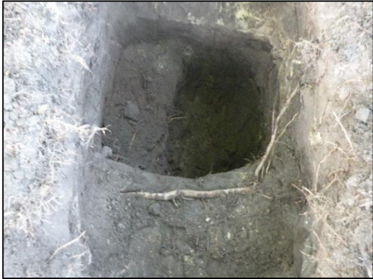
Profielkuil boom 24, extensieve beworteling