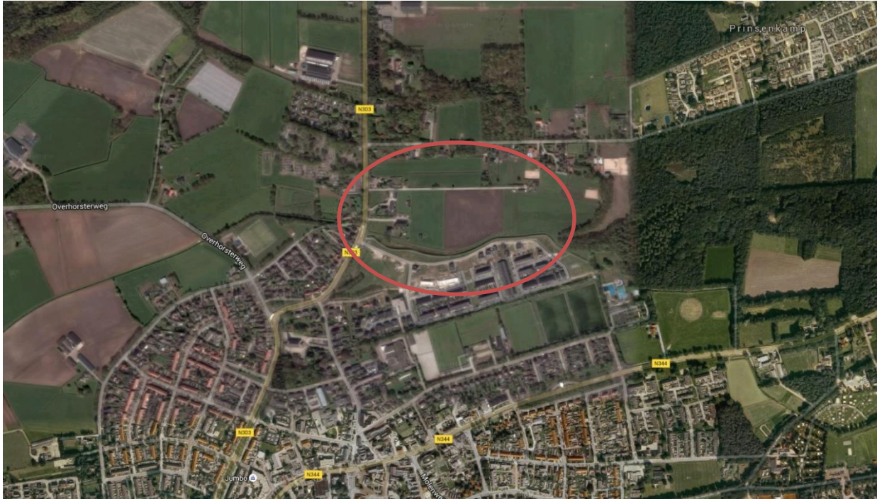
Afb. 1.: Indicatie van de locatie van het plangebied Blankensgoed-Noord, gelegen ten noorden van Voorthuizen

In de naoorlogse periode zijn op de bovengenoemde gevechtslocaties in de omgeving van het plangebied verschillende explosieven geruimd. Vanaf 1945 tot 1970 werd dit door diverse overheidsdiensten uitgevoerd, met ieder een eigen archief. Deze archieven zijn nooit gecentraliseerd en bewaard gebleven. Pas vanaf 1970 heeft de Explosieven Opruimings Dienst Defensie (EODD) iedere melding van aangetroffen munitie bijgehouden. Uit dit archief blijkt dat aan de Rubenslaan 67, wat zich direct ten westen van het plangebied bevindt, een rookgranaat van een 2 inch mortier is aangetroffen. Aan de Prinsenweg 6, ten noorden van het plangebied, is klein kaliber munitie (KKM) afkomstig van een defecte Canadese tank aangetroffen.