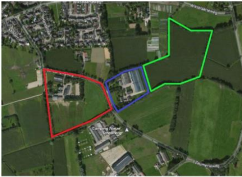
Figuur 2-1. Projectlocatie deelgebied 1 (Schoonengweg 6) is rood omlijnd; deelgebied 2 (Schoonengweg 7) is groen omlijnd. Het blauw omlijnde gebied betreft een deel van deelgebied 2 waar inmiddels gestart is met het realiseren van woningen.