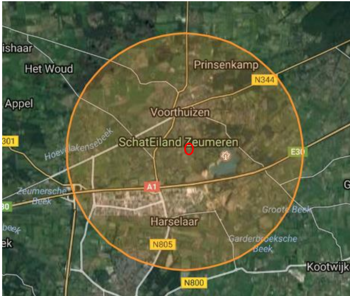
Figuur 5-1. Ligging plangebied (rood omlijnd) ten opzichte van beschermde Natura 2000-gebieden (niet aanwezig binnen een straal van 3 km).

Het plangebied ligt niet in een Natura 2000-gebied (zie figuur 5-1). Aangezien de voorgenomen ontwikkelingen kleinschalig zijn en geen negatieve effecten als gevolg van externe werking te verwachten zijn, is toetsing aan de regelgeving omtrent deze beschermde gebieden niet van toepassing. Wel bestaat er de kans dat de provincie een AERIUS berekening vraagt om de effecten van een toename van stikstofdepositie (tijdelijk en permanent) op Natura 2000-gebieden in kaart te brengen.