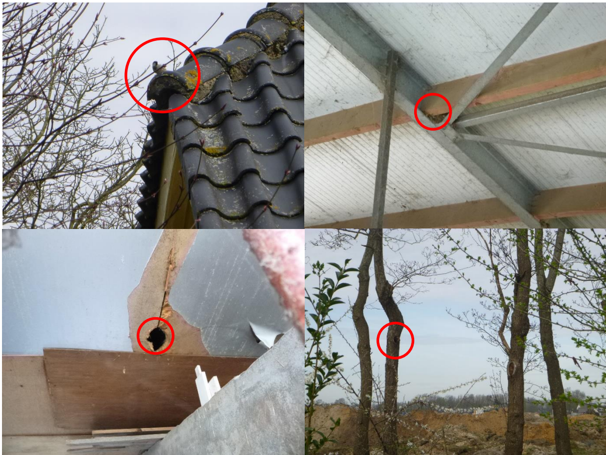
Figuur 3-1. Van links naar rechts en van boven naar beneden: huismus nestelt onder dakrand woonhuis; oude nesten boerenzwaluw in open opstal; aangetroffen openingen in opstallen mogelijk geschikt voor gebouw bewonende vleermuis; holtes in bomen mogelijk geschikt voor boom bewonende vleermuis of spreeuw.