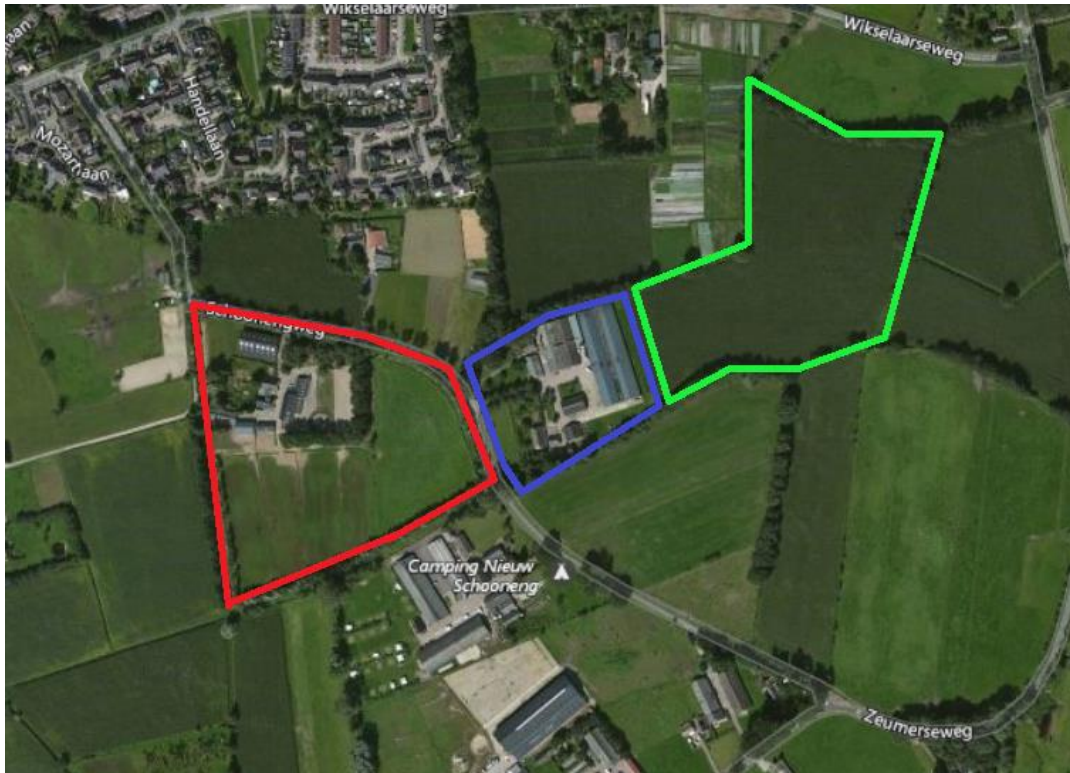
Figuur 2-1. Projectlocatie deelgebied 1 (Schoonengweg 6) is rood omlijnd; deelgebied 2 (Schoonengweg 7) is groen omlijnd. Het blauw omlijnde gebied betreft een deel van deelgebied 2 waar inmiddels gestart is met het realiseren van woningen.

De projectlocatie bestaat uit twee deelgebieden welke ca. 175 meter uit elkaar liggen. Ze bevinden zich aan de Schoonengweg 6 en 7 te Voorthuizen (zie figuur 2-1). De deellocaties worden omgeven door landbouwgrond (akkerbouw) en er liggen woningen, bedrijven en een camping langs de weg. De twee deelgebieden worden in de volgende sub paragrafen toegelicht.