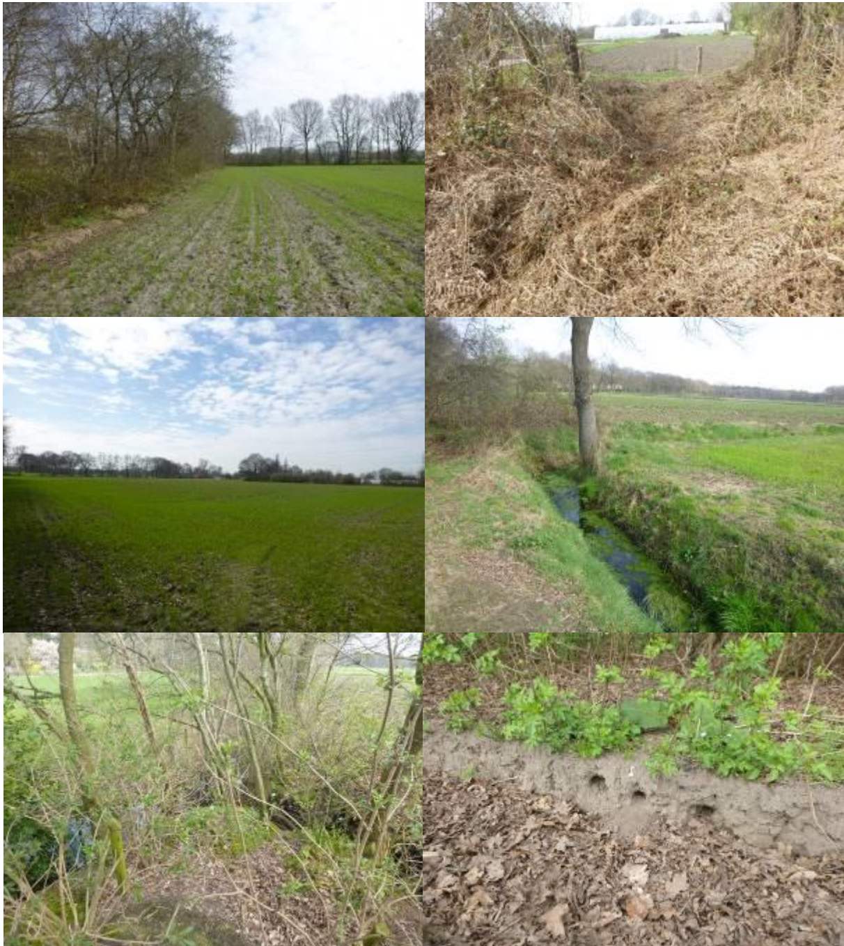
Figuur 2-4. Huidige situatie groenstructuren deelgebied 2. Van links naar rechts en van boven naar beneden: zicht op de noordelijke rand van de akker met bomenrij en struweel; strook struweel midden op de akker; uitzicht op de akker in zuidelijke richting; rand van het perceel met watergang; dichte begroeiing aan de noordoostelijke zijde van de akker en aarden rand met hollen aan de noordzijde.

Deze rand bestaat uit een smalle strook grasland zonder overige groenstructuren. De andere randen van het onderzoeksgebied aan de noord- west- en zuidzijde grenzen aan weilanden en zijn er van gescheiden door watergangen met een breedte van 1-2 m. De wateren hebben geen oeverbeschoeiing, een matig doorzicht en er is geen stroming aanwezig. De randen van de onderzoekslocatie bestaan uit groenstroken (bomen, struweel en grasbermen). Een impressie van de groenstructuren is weergegeven in figuur 2-4.