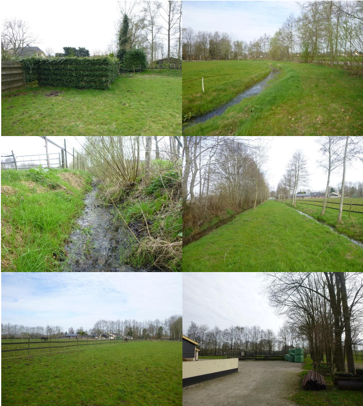
Figuur 2-3. Huidige situatie groenstructuren en oppervlaktes deelgebied 1. Van links naar rechts en van boven naar beneden: tuin met klimophaag; watergang langs de oostzijde met bomen; watergang met struweel aan de zuidoostzijde en westzijde. Rechtsonder is een deel van de verharde ondergrond te zien.