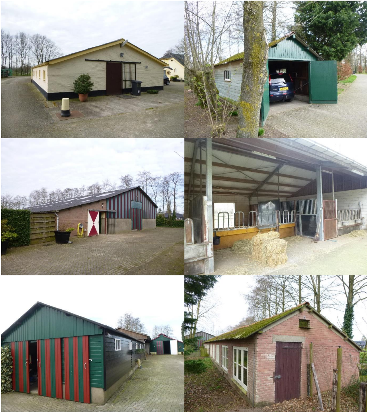
Figuur 2-2. Huidige situatie gebouwen deelgebied 1. Van links naar rechts en van boven naar beneden: bedrijfswoning (rechts) met open opstal (midden); garage; manege; vooraanzicht open opstal; vier overige schuren. De gebouwen op de foto's links midden en links onder zijn potentieel geschikt als vleermuis verblijfplaats.