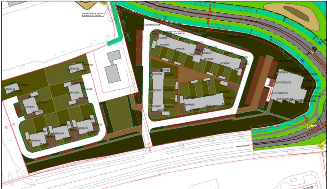
Cumulatieve geluidsbelastingen (incl. aftrek ex artikel 110g Wgh)

Op grond van het gemeentelijke geluidsbeleid is een geluidsluwe gevel (gevel waarbij voldaan wordt aan de voorkeursgrenswaarde van 48 dB) en geluidsluwe buitenruimte (tuin of balkon) gewenst. In de onderstaande figuur zijn de cumulatieve geluidsbelastingen (inclusief aftrek ex artikel 110g Wgh) weergegeven.