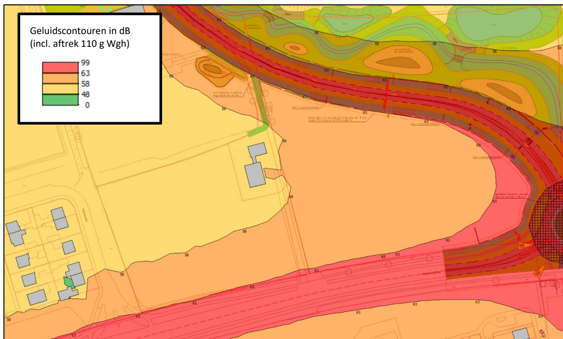
Ligging van de contouren

Het vergroten van de afstand tussen de wegen en de nieuwe woningen, zodanig dat de geluidsbelasting wel voldoet aan de voorkeursgrenswaarde, zorgt voor een dusdanig grote afstand dat dit niet wenselijk is. In de onderstaande figuur zijn de geluidscontouren (inclusief aftrek op grond van artikel 110g Wgh) weergegeven: