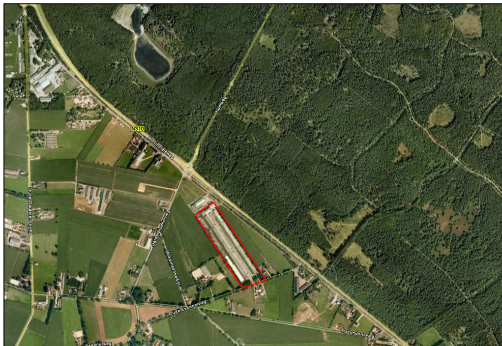
Figuur 1. Ligging van het plangebied

Het plangebied is gelegen aan de Oude Essenerweg te Kootwijkerbroek, gemeente Barneveld. Het plangebied betreft twee, niet meer in gebruik zijnde, pluimveestallen en enkele schuren. In figuur 1 is de exacte ligging van het plangebied te zien.