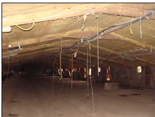
Foto 1. Binnenkant stal

Het plangebied bestaat voor het grotendeels uit bebouwing. Er staan in het gebied twee lange stallen met een lengte van ongeveer 300 meter. Tussen deze stallen ligt verharding. Aan de zuidzijde van het plangebied ligt kleine ruigte met enkele bomen en struiken. Aan de noordzijde staan ook twee schuren. Het plangebied is gelegen in een het agrarisch gebied. Aan de noordwestzijde wordt het plangebied slechts door de N310 gescheiden van de Veluwe. Een en ander is zichtbaar in de onderstaande foto-impressie.