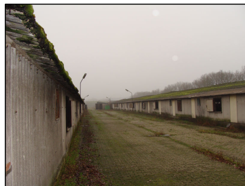
Foto 2. buitenkant stal