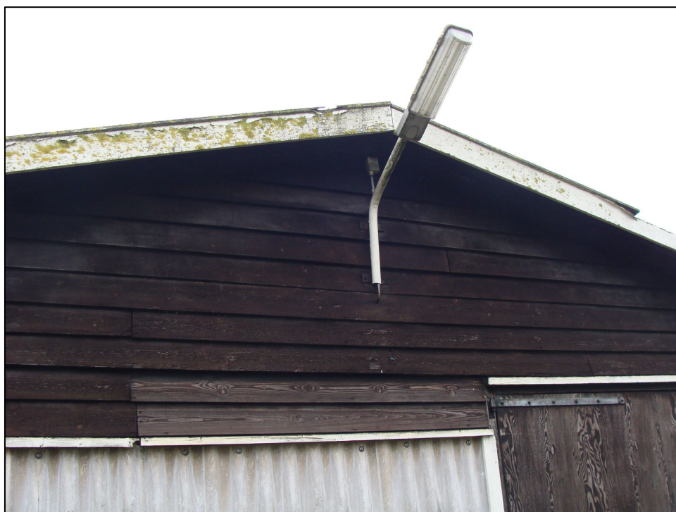
Foto 5. Geschikte verblijfplaats voor de laatvlieger.

De stallen zijn deels geschikt als vaste rust- en verblijfplaats. De gevelbetimmering en kieren in de schuren kunnen als verblijfplaats dienen. De gevelbetimmering is vooral geschikt voor de laatvlieger en de stal kan geschikt zijn voor de gewone grootovleermuis. Voor de gewone dwergvleermuis is het plangebied matig geschikt, maar solitaire dieren kunnen wel incidenteel gebruikmaken van de schuur als zomer- en paarverblijf. Voor de ruige dwergvleermuis, watervleermuis en rosse vleermuis zijn in het plangebied geen geschikte locaties voor een verblijfplaats aanwezig. Dit zijn namelijk vooral boombewonende vleermuissoorten en bomen met holtes zijn in het plangebied niet aanwezig.