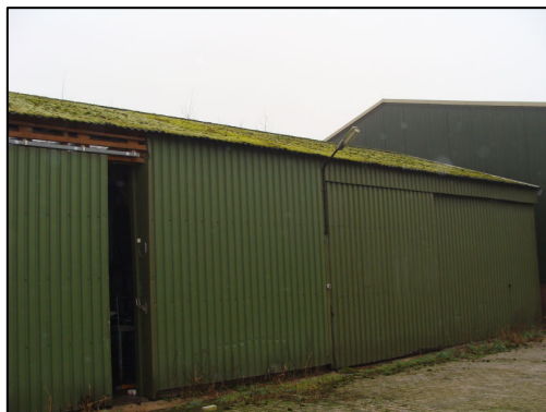
Foto 3. Schuur