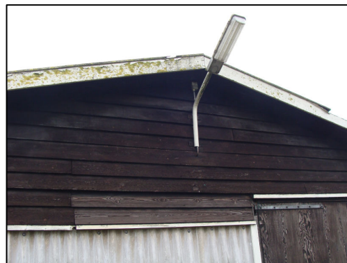
Foto 4. Gevel stal