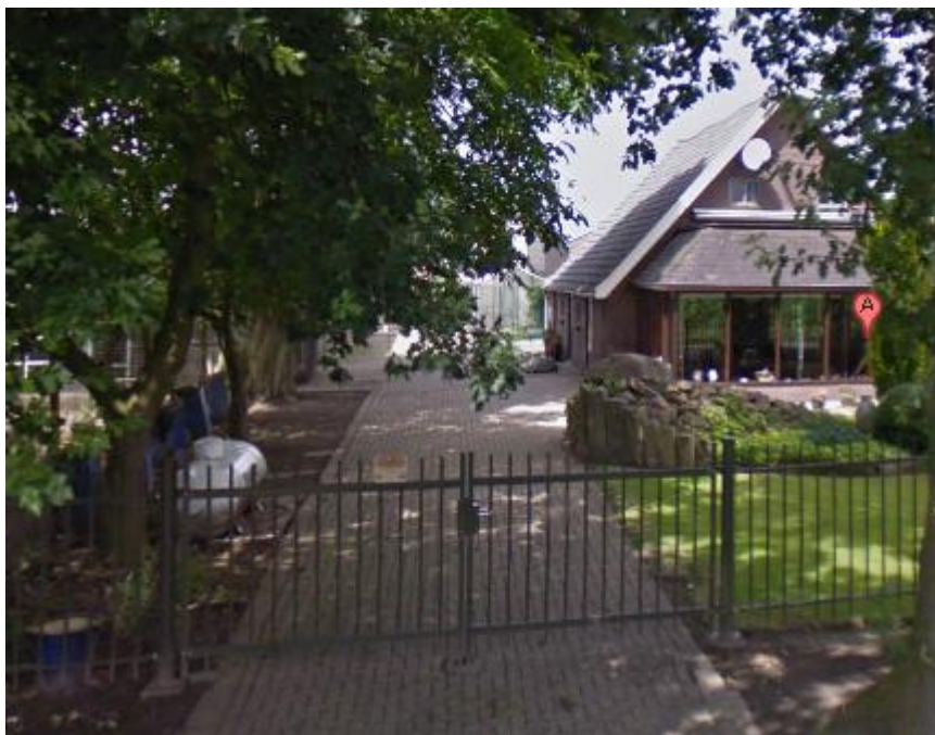
Figuur: propaantank aan de Nederwoudseweg 31

Via Google streetview is de propaantank aan de Nederwoudseweg 31 zichtbaar.