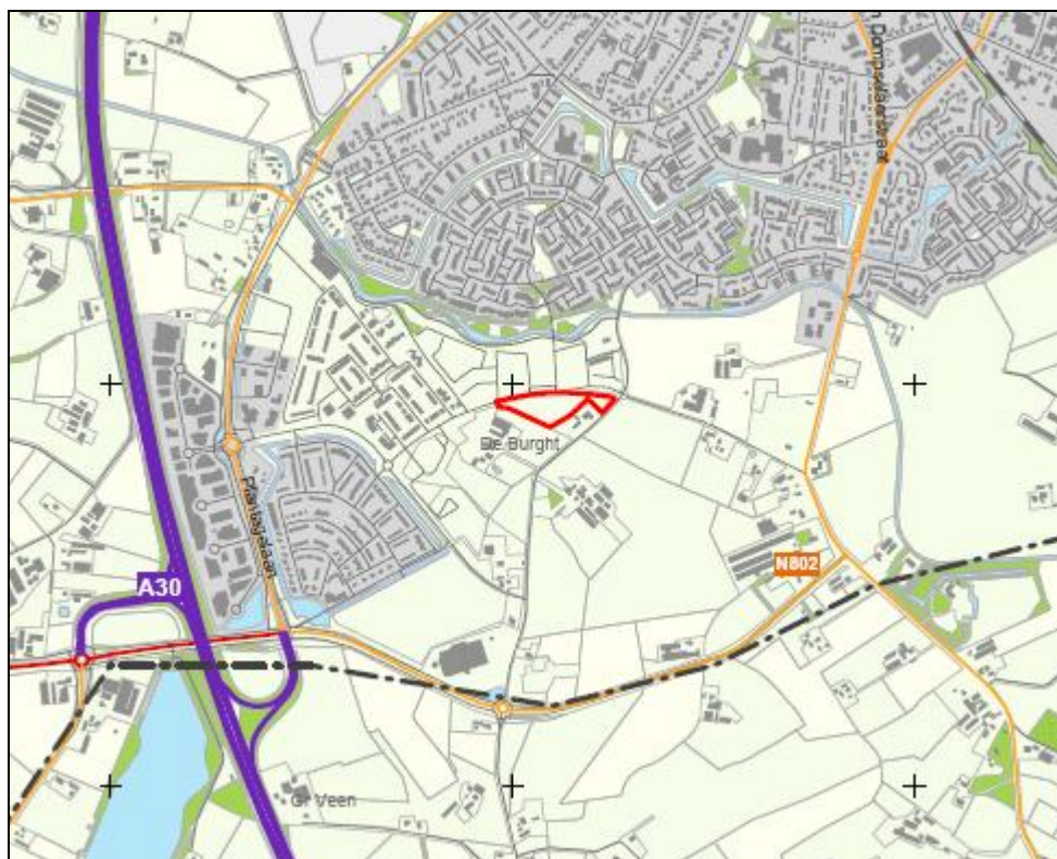
Figuur: ligging van het plangebied

Het plangebied is in onderstaande figuur roodomrand weergegeven.