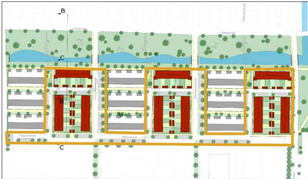
Weergave van de wenselijke ontwikkeling van het plangebied.

De voorgenomen activiteit bestaat uit het bouwen van nieuwe woningen in de drie deelgebieden. Op onderstaande verbeelding wordt de wenselijke nieuwbouw weergegeven.