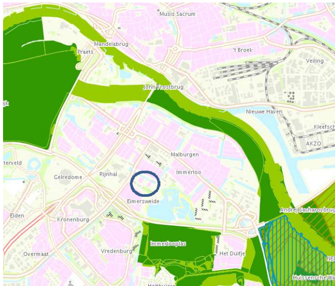
Begrenzing van het Gelders Natuurnetwerk.

Het plangebied ligt niet in het in de Gelders Natuurnetwerk. Op onderstaande kaart wordt het Gelders Natuurnetwerk weergegeven. Het plangebied wordt met de cirkel aangeduid.