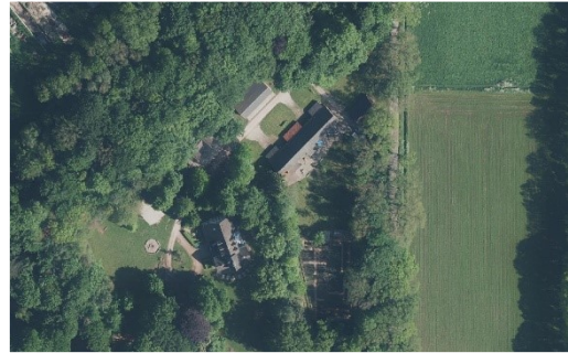
Figuur 1: Kaart projectgebied