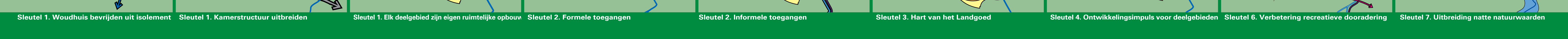
Sleutel 1. Woudhuis bevrijden uit isolement Sleutel 1. Kamerstructuur uitbreiden Sleutel 1. Elk deelgebied zijn eigen ruimtelijke opbouw Sleutel 2. Formele toegangen Sleutel 2. Informele toegangen Sleutel 3. Hart van het Landgoed Sleutel 4. Ontwikkelingsimpuls voor deelgebieden Sleutel 6. Verbetering recreatieve doorradering Sleutel 7. Uitbreiding natte natuurwaarden