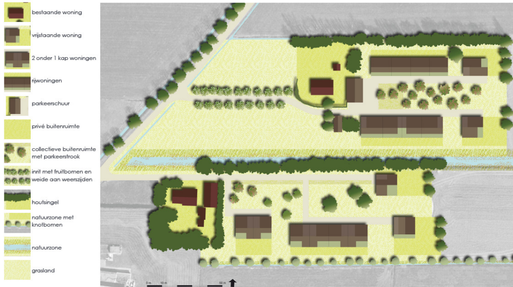
Kaartje realisatie van woningen aan de Leigraaf 14 /16 te Klarenbeek