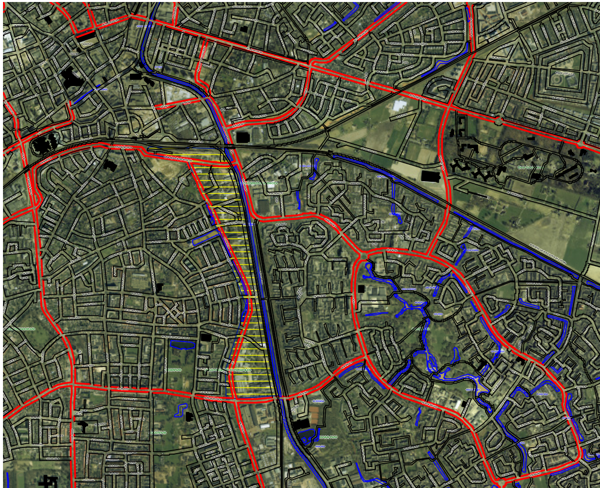
Kaart 1 Situering projectgebied Kanaalzone zuid

Beknorte omschrijving groene waarden: Deellocatie 1 deelgebied noord (zie kaart 2).