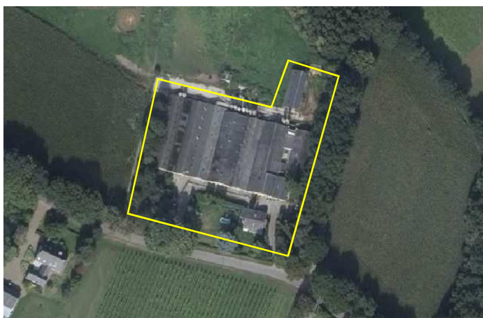
Verbeelding van het plangebied. De begrenzing van het plangebied wordt met de gele lijn aangeduid

Het plangebied bestaat uit een voormalig agrarisch erf waarop een varkenshouderij was gevestigd. Het plangebied bestaat uit bebouwing, erfverharding, tuin met sierplanten, heersters en evergreens en een gemengde loofhoutsingel bestaande uit lijsterbes, zomereik, ruwe berk, boswilg en veldesdoorn. Aan de voorzijde van het erf staat een bakstenen woning. Deze beschikt over een (holle) spouw, beschoten kap en is gedekt met gebakken dakpannen. Aan de noordzijde staat een vrij jonge kapschuur. Deze heeft steens muren, geen dakisolatie en is gedekt met golfplaten. In het midden van het erf staan een zestal, tegen elkaar aan gebouwde varkensstallen. Deze stallen zijn gebouwd van bakstenen en gedekt met golfplaten. De stallen hebben een geïsoleerde spouw en zijn gedekt met golfplaten. De stallen hebben dakisolatie in de vorm van hardschuim isolatiepanelen. De woning werd tijdens het veldbezoek bewoond, maar de stallen stonden reeds geruime tijd leeg. Op onderstaande afbeelding wordt het plangebied in detail weergegeven, evenals de begrenzing. Voor een verbeelding van het plangebied; zie fotobijlage.