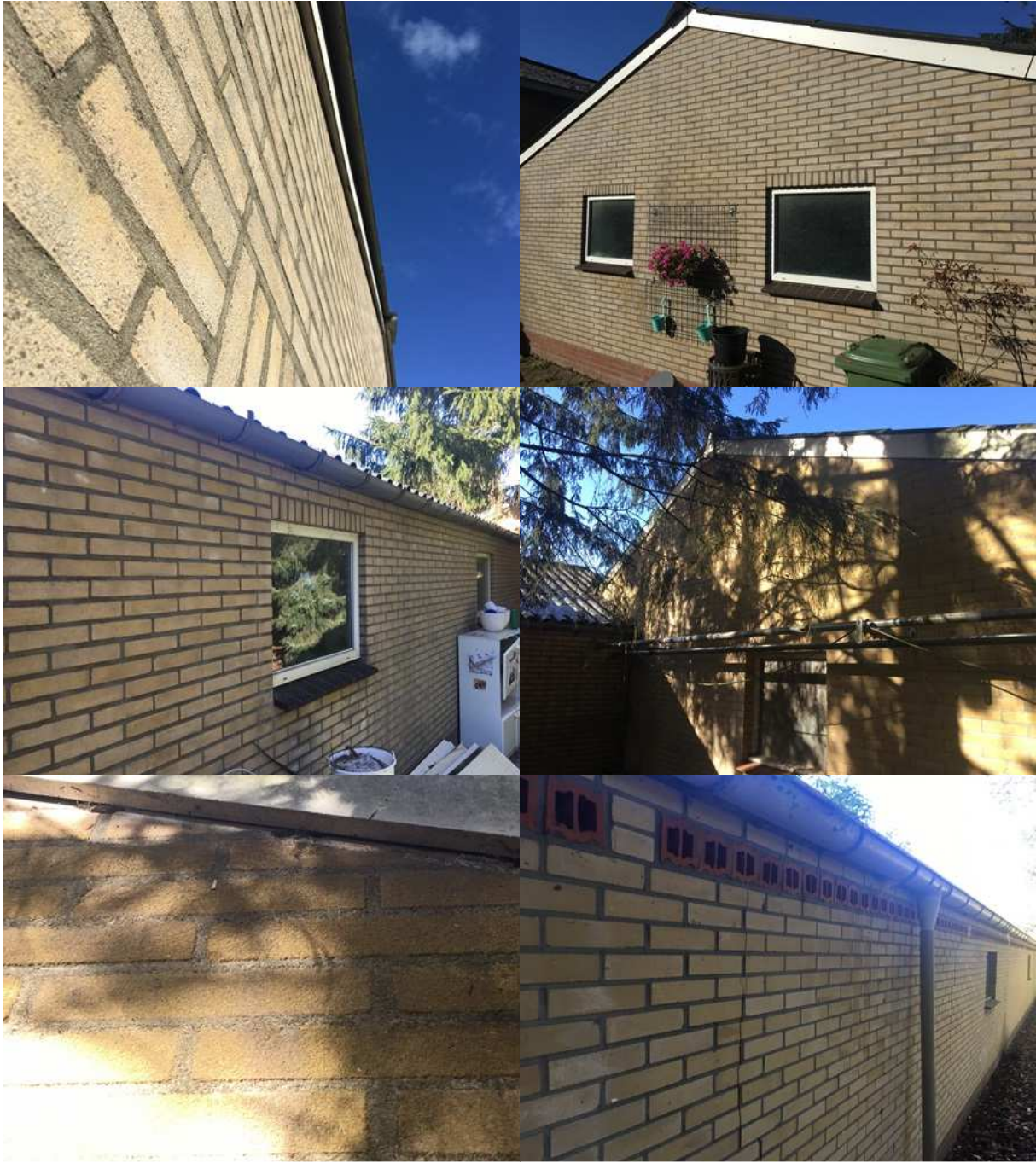
Bijlage 3. Fotobijlage. Impressie van het plangebied en de directe omgeving.