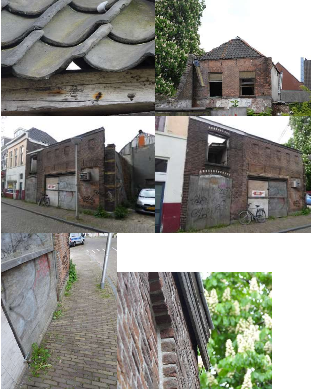
Bijlage 3. Fotobijlage. Impressie van het plangebied en de directe omgeving.