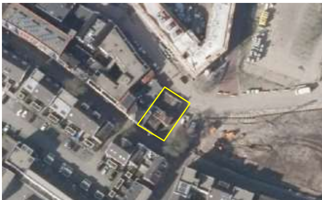
Detailopname van het plangebied. De begrenzing van het plangebied wordt met de gele lijn aangeduid.

Het plangebied bestaat uit bebouwing, erfverharding en natuurlijke opslag. In het plangebied staat een gedeeltelijk ingestort pand dat deels al gesloopt is. Een deel van de oorspronkelijke bebouwing staat nog overeind, maar verkeerd in zeer slechts staat. Het gebouw dat nog staat is gebouwd van bakstenen en is gedekt met oud Hollandse dakpannen. Het gebouw beschikt niet over een spouw, dak- of wandisolatie. Vanwege het ontbreken van dakpannen is het pand niet wind- of waterdicht. Aan de achterzijde van het pand ligt erfverharding en natuurlijke opslag van robinia ( Robinia pseudoacacia ). Het gebouw is onbewoonbaar vanwege de slechte staat. Op onderstaande luchtfoto wordt de ligging van het plangebied op een weergegeven, evenals de begrenzing. Voor een impressie van het plangebied wordt verwezen naar de fotobijlage.