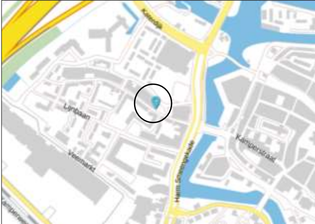
Globale ligging van het plangebied. De ligging van het plangebied wordt met de blauwe marker in de cirkel aangeduid (bron kaart: PDOK).

Het plangebied is gesitueerd aan de Hoogstraat 28 te Zwolle. Het ligt in de stad Zwolle en wordt omgeven door stedelijk gebied. Op onderstaande afbeelding wordt de globale ligging van het plangebied weergegeven op een topografische kaart.