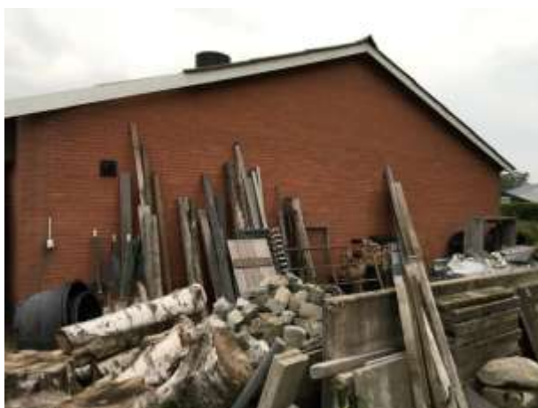
Amfibieën kunnen een (winter)rustplaats bezetten onder rommel en opgeslagen (bouw)

Tijdens het veldbezoek zijn geen amfibieën waargenomen, maar gelet op de inrichting en het gevoerde beheer, wordt het plangebied als functioneel leefgebied voor sommige algemene en weinig kritische amfibieënsoorten beschouwd. Amfibieën als bruine kikker en gewone pad benutten het plangebied als foerageergebied en mogelijk bezetten ze er een (winter)rustplaats. Deze soorten kunnen een (winter)rustplaats bezetten onder strooisel en bladeren en onder opgeslagen spullen/rommel, brandhout, en (bouw)materialen in de buitenruimte. De bebouwing is voor amfibieën niet toegankelijk om te betreden. Het intensief beheerd agrarisch cultuurland vormt geen geschikt leefgebied voor amfibieën. Het plangebied wordt niet als functioneel leefgebied van zeldzame amfibieënsoorten als kamsalamander, rugstreeppad of poelkikker beschouwd. Geschikt voortplantingsbiotoop ontbreekt in het plangebied.