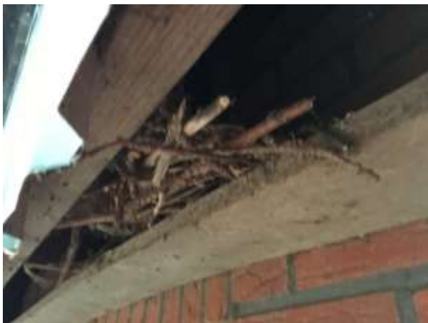
Oud kauwennest in één van de te slopen varkensstallen

Het plangebied behoort tot functioneel leefgebied van verschillende vogelsoorten. Vogels benutten het plangebied als foerageergebied en vermoedelijk nestelen er jaarlijks vogels in het plangebied. Vogels kunnen nestelen in de beplanting en in de bebouwing. Alle bebouwing in het plangebied beschikt over invliegopeningen waardoor vogels een nestplaats in de bebouwing kunnen bezetten. Vogelsoorten die mogelijk in het plangebied nestelen zijn kauw, merel, houtduif, koolmees, pimpelmees en winterkoning. Het intensief beheerd agrarisch cultuurland vormt geen nestplaats voor (weide)vogels maar vormt wel foerageergebied voor tal vogels die foerageren in het open, agrarische cultuurland. Het cultuurland wordt niet als essentieel foerageergebied van steenuilen beschouwd. In het plangebied zijn geen aanwijzingen gevonden dat huismussen, boeren- en huiszwaluwen er een rust- of voortplantingsplaats bezetten. Tevens zijn geen aanwijzingen gevonden dat steen- of kerkuil er een vaste rust- of nestplaats bezetten. Aanwezigheid van deze soorten in gebouwen is doorgaans gemakkelijk vast te stellen aan de hand van braakballen, schijtsporen en ruiveren. Er zijn ook geen aanwijzingen dat roofvogels een vaste rust- of nestplaats in het plangebied bezetten.