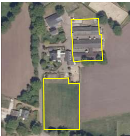
Begrenzing van het plangebied; deze wordt met de gele lijnen aangeduid.

Het plangebied vormt een varkenshouderij, waar al enige tijd geleden de bedrijfsactiviteiten gestaakt zijn. Het bestaat uit bebouwing, twee sleufsilos, veevoedersilos, grasland, erfverharding, mesthopen en opgeslagen spullen/rommel en puin. De bebouwing staat in het noordelijke deel van het plangebied en bestaat uit drie varkensstallen. Deze varkensstallen beschikken over bakstenen buitengevels met luchtspouw en zijn gedekt met golfplaten. Ten noorden van de varkensstallen liggen de twee sleufsilos. Tussen en rondom de bebouwing liggen opgeslagen spullen/rommel en puin (bestaande uit: oud ijzer, hout, steen- en betonblokken). De mesthopen liggen tegen de zuidzijde van de meest zuidelijk gelegen varkensstal. De enkele veevoedersilos staan langs de middelste- en meest zuidelijk gelegen varkensstal. Het zuidelijke deel van het plangebied bestaat volledig uit grasland. Dit grasland wordt intensief beheerd (bemesten, maaien en afvoeren maaisel). Het grasland grenst met de westzijde aan een kavelgrenssloot. Ten westen van het plangebied ligt de Huurnerweg. Op onderstaande luchtfoto is de begrenzing van het plangebied aangegeven. Voor een impressie van het plangebied wordt verwezen naar de fotobijlage.