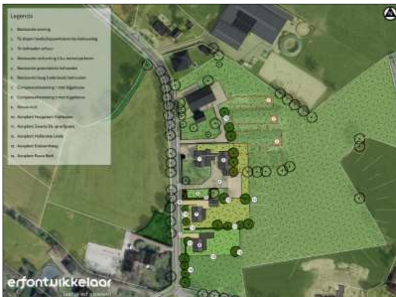
Verbeelding van het wenselijk eindbeeld (bron: De erfontwikkelaar).

Er zijn plannen om alle bebouwing in het plangebied te slopen en twee nieuwe woningen met twee bijgebouwen te realiseren. Deze woningen met bijgebouwen worden gerealiseerd op het zuidelijk gelegen grasland en worden d.m.v. een nieuw aan te leggen (verharde) inrit in verbinding gebracht met de Huurnerweg. Aangenomen wordt dat de sleufsilos, mesthopen, veevoedersilos en opgeslagen spullen/rommel en puin verwijderd worden. Op de plek van de te slopen stallen worden enkele hoogstamfruitbomen geplant. Rondom de nieuwe woningen komt aanplant van Zwarte Els, Hollandse Linde, Ruwe Berk, een esdoornhaag en ook enkele hoogstam fruitbomen. Op onderstaande afbeelding wordt een plattegrond van het wenselijk eindbeeld weergegeven.