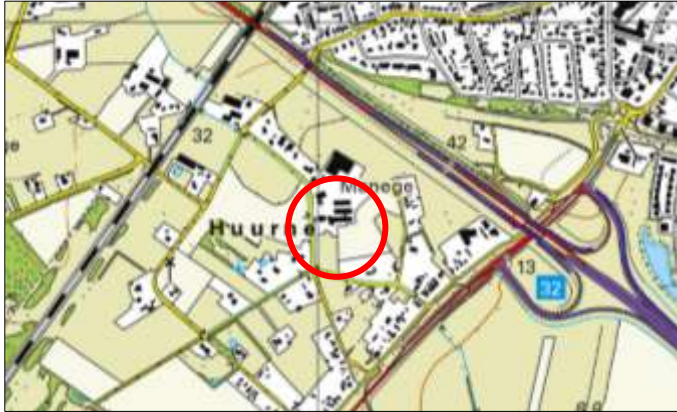
Globale ligging van het plangebied. De ligging van het plangebied wordt met de rode cirkel aangeduid.

Het plangebied is gesitueerd aan de Huurnerweg 4 te Wierden. Het ligt circa 300 meter ten zuidwesten van de woonkern Wierden en wordt omgeven door landelijk gebied. Op onderstaande afbeelding wordt de globale ligging van het plangebied weergegeven op een topografische kaart.