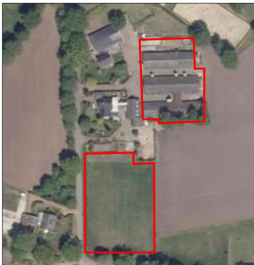
Begrenzing van het onderzoeksgebied; deze wordt met de rode lijnen aangeduid.

Om het effect van de voorgenomen activiteiten volledig in beeld te kunnen brengen zijn de naald- en loofboom die tegen de zuidzijde van de meest zuidelijk gelegen varkensstal staan meegenomen in het onderzoek. De kavelgrenssloot wordt niet meegenomen in het onderzoek omdat deze te steile oevers heeft waardoor amfibieën niet weg kunnen komen uit deze sloot. Deze sloot wordt daarom niet als geschikt habitat voor amfibieën beschouwd. Indien in dit rapport wordt gesproken over plangebied, wordt onderstaand onderzoeksgebied bedoeld.