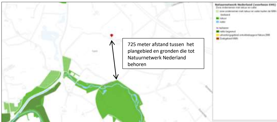
Ligging van Natuurnetwerk Nederland in de omgeving van het plangebied. Gronden die tot het Natuurnetwerk Nederland behoren worden met de donkergroene kleur op de kaart aangeduid. De ligging van het plangebied wordt met de rode marker aangeduid.