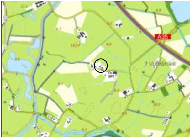
Globale ligging van het plangebied. De ligging van het plangebied wordt met de cirkel aangeduid.

Het plangebied is gesitueerd op het adres Ypeloweg 33 te Enter. Het ligt in het buitengebied, 1,7 kilometer ten westen van de stad Almelo. Het plangebied wordt aan alle zijden omgeven door agrarisch cultuurlandschap. Op onderstaande afbeelding wordt de globale ligging van het plangebied weergegeven.