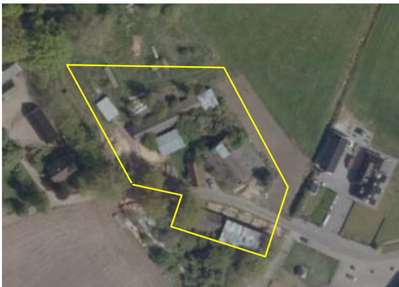
Detailopname van het plangebied.

Het plangebied vormt een agrarisch erf en bestaat uit erfverharding, bebouwing en grasland (verruigd gazon). Op het erf staan een oude, deels vervallen boerderij, drie kaploodsen (waarvan twee ten zuiden van de Ypeloweg), een stal, een stenen en een houten schuur. De oude boerderij is in het verleden uitgebreid met een stal. De boerderij, een kleine schuur en de stal zijn gebouwd van bakstenen, maar beschikken niet over een spouw. De boerderij is deels gedekt met riet, deels met golfplaten (aanbouw) en deels met dakpannen. Op een stenen schuurtje na, zijn alle overige gebouwen gedekt met golfplaten. Geen van de gebouwen op het erf beschikt over een beschoten kap. De gebouwen in het plangebied staan reeds enige tijd leeg. De staat van onderhoud van de boerderij is slecht; sommige ramen aan de voorzijde van de boerderij staan open en het dak is deels ingestort. Op onderstaande afbeelding wordt het plangebied in detail weergegeven, evenals de begrenzing. Voor een verbeelding van het plangebied wordt naar de fotobijlage verwezen.