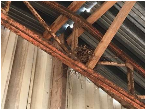
Oud nest van de houtduif in één van de kaploodsen op het erf.

Het plangebied behoort tot functioneel leefgebied van vogels. Vogels benutten de buitenruimte van het plangebied als foerageergebied en er nestelen vermoedelijk ieder jaar vogels in de beplanting (klimop) en toegankelijke gebouwen, zoals de kaploodsen en de oude boerderij. Tijdens het veldbezoek is een oud nest van de houtduif in een kaploods aangetroffen. Andere vogelsoorten die mogelijk in de bebouwing nestelen zijn merel, holenduif, koolmees, pimpelmees en witte kwikstaart.